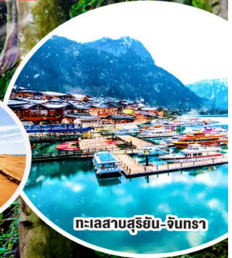
ทะเลสาบสุริยัน-จินตรา

• ล่องเรือชมความงาม ทะเลสาบสุริยันจินตรา • ช้อป ชิม ซิล ได้วันในทีมาร์เก็ต, ซีเหมินตง, Gloria Outlets • นั่งรถไฟบนอุทยานแห่งชาติอาลีซาน 1 ใน 3 เส้นทางรถไฟสวยที่สุดในโลก