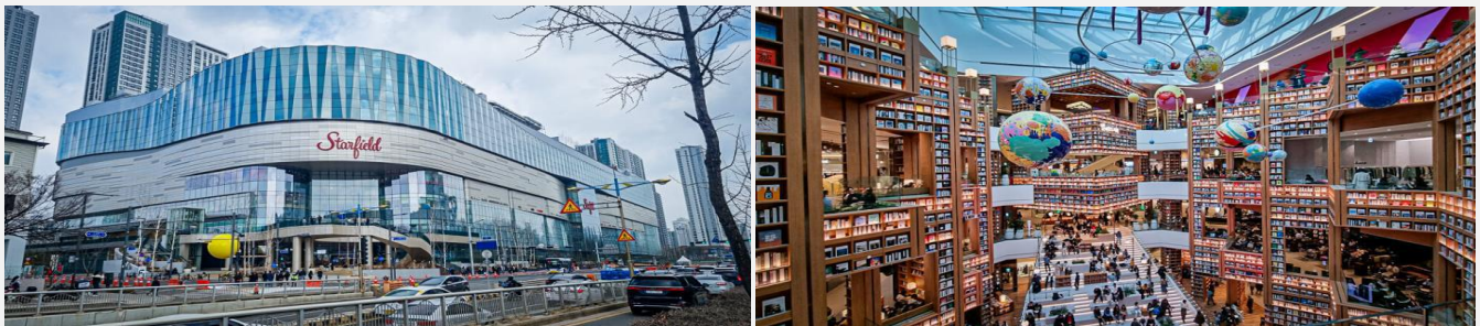
และเดินเล่นได้ตามอัธยาศัย

จากนั้นพาทุกท่านเดินทางสู่ห้าง Starfield Coex Mall Suwon หลาย ๆ ท่านอาจจะรู้จักสาขา Seoul แต่จริงๆ แล้วห้องสมุดยังมีอีกสาขาที่คือ Suwon บอกเลยว่าถึงจะอยู่นอกเมือง แต่ความอลังการของห้องสมุดนั้นใหญ่กว่าโซลหลายเท่าตัว ด้านในยังมีทั้งร้านกาแฟ และร้านไอศกรีมให้ทุกท่าน ได้นั่งพักผ่อนจิบกาแฟ ถ่ายรูป