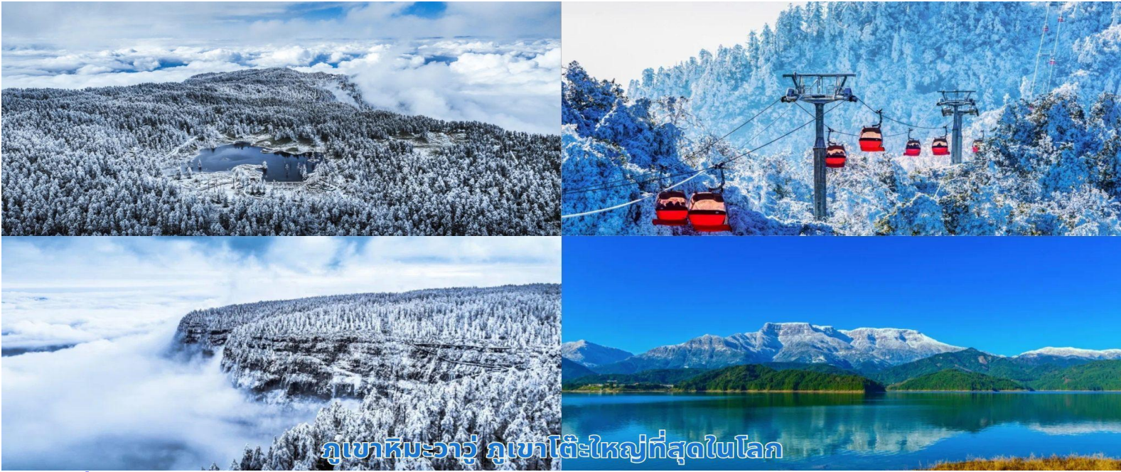
ภูเขาหิมะวาร์ู ภูเขาโต๊ะใหญ่ที่สุดในโลก

จากนั้นนำท่านเที่ยวชม ภูเขาหิมะวาร์ู ภูเขารูปโต๊ะใหญ่ที่สุดในโลก นำท่านขึ้นกระเช้าขึ้นสู่ยอดเขา ตั้งอยู่ในเขตหงหย่า เมืองเหมยซาน ซึ่งเป็นบ้านเกิดของตงโป มณฑลเสฉวน โดยมีความสูง 2,830 เมตรจากระดับน้ำทะเล และมีพื้นที่บนยอดเขาประมาณ 110,000 ตร.กม. ที่นี่ได้รับการจัดอันดับให้เป็นแหล่งท่องเที่ยวระดับ AAAA แห่งชาติในเดือนมีนาคม 2019 เป็นที่รู้จักกันในนามของ โลกแห่งน้ำ โลกแห่งถ้ำ อาณาจักรแห่งดอกไม้ เพลแห่งหิมะ บ้านเกิดของเมฆ และพิพิธภัณฑ์สัตว์และพืช