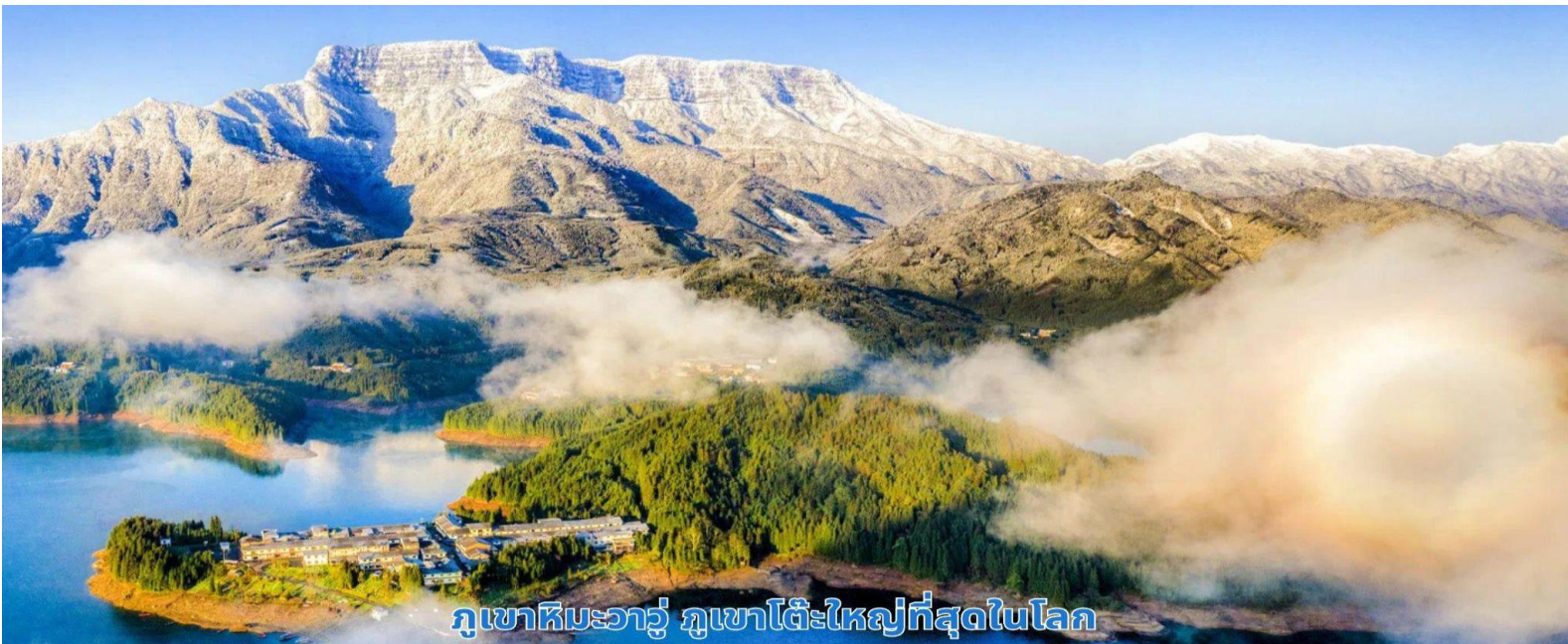
ภูเขาหิมะวาร์ู ภูเขาโต๊ะใหญ่ที่สุดในโลก