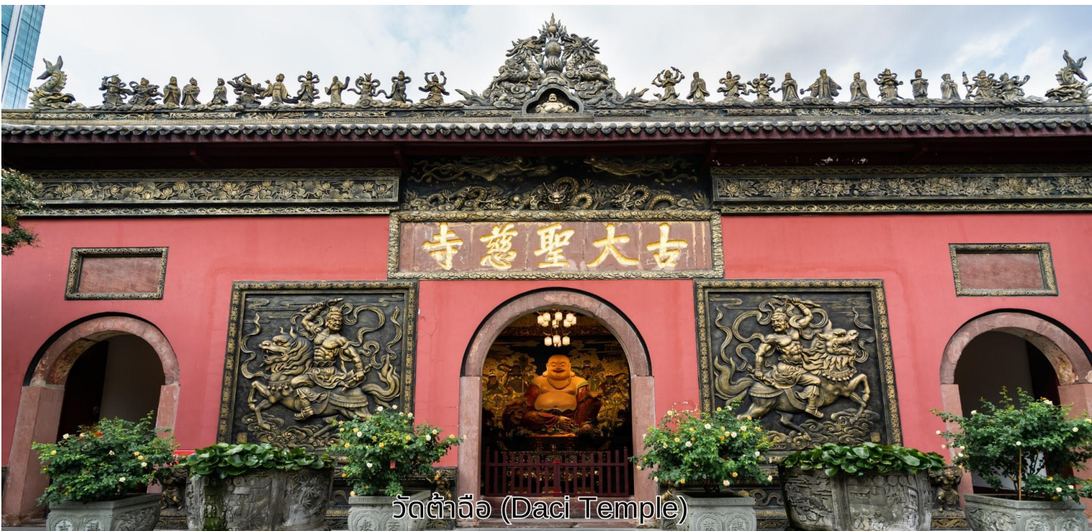
วัดต้าจื่อ (Daci Temple)

เช้า บริการอาหารเช้า ณ ห้องอาหารของโรงแรม