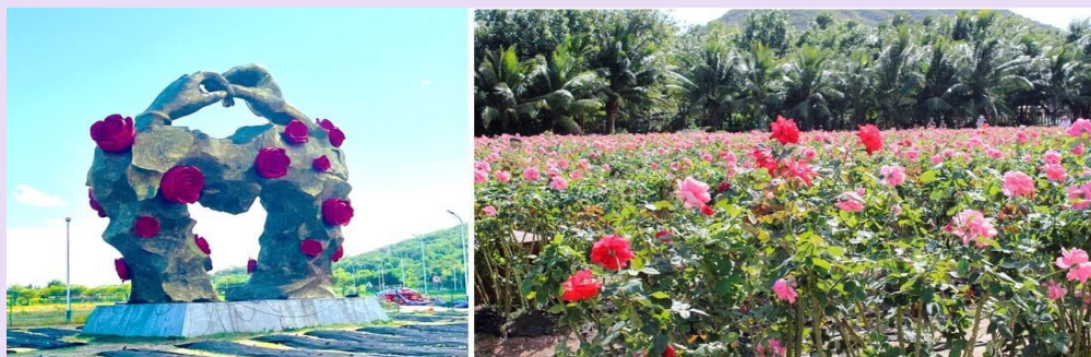
VSX52SL-3 ไฉไล ไทหล่า เน้นถูกเที่ยวครบ คุ่มมมคุ่ม 5วัน2คืน By SL

นำท่านเยี่ยมชม ร้านผ้าไหม ให้ท่านได้เลือกซื้อผลิตภัณฑ์จากไหม ตามอัยาศัย (ใช้เวลาประมาณ 60 - 90 นาที) จากนั้นนำท่านชม ทุ่งดอกกุหลาบอ่าวย้าหลง (รวมรถกอล์ฟ) ให้ท่านได้ เพลิดเพลินกับการถ่ายรูปเพื่อเก็บความประทับใจ และเข้าชมสินค้าที่ผลิตด้วยดอกกุหลาบหลากหลาย เช่น ครีมทาหน้า น้ำหอมกลิ่นกุหลาบ ขนมดอกกุหลาบ เป็นต้น