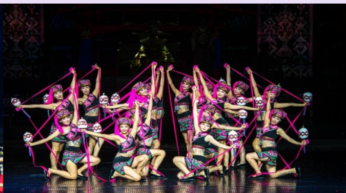
VSYX52SL-3 ใจไล ไทหล่า เน้นถูกเที่ยวครบ คุ้มมมคุ้ม 5วัน2คืน By SL