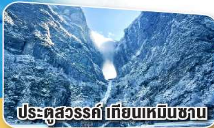
ประตูสวรรค์ เทียนเหมินซาน