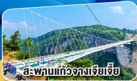
สะพานแกว่งจางเจียเจีย