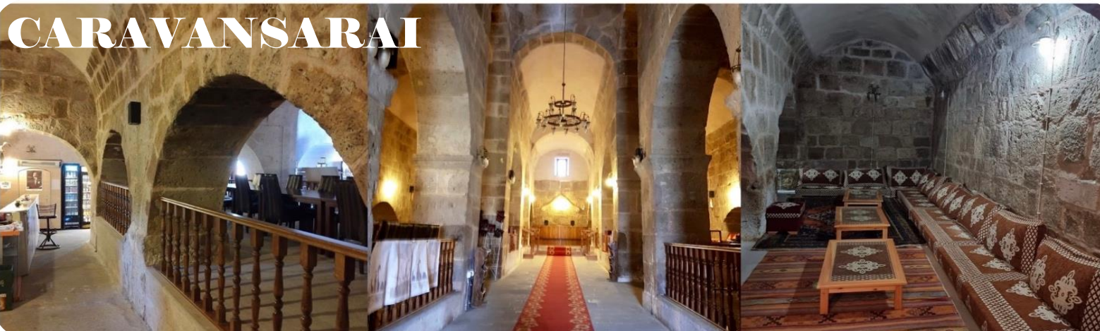
หน้า 8 (ภาพใช้เพื่อการโฆษณาเท่านั้น)

เช้า | บริการอาหารเช้า ณ ห้องอาหารของโรงแรม จากนั้นเดินทางสู่ ปามุคคาเล่ Pamukkale ใช้เวลาเดินทาง 8 ชม.(630 กม.) ระหว่างทางแวะถ่ายรูป CARAVANSARAI ที่พักแรมระหว่างทางของกองคาราวาที่เดินทางเส้นทางสายไหมของชาวเติร์กในสมัยออตโตมัน มีกำแพงล้อมรอบเพื่อป้องกันลมและฝน รวมทั้งพายุรุนแรงและการปล้นสดมภ์