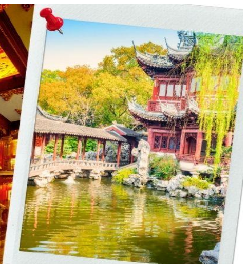
สวนอู่หยวน - ตลาดเจิ้งหวังเมี่ยว

จากนั้นนำท่านช้อปปิ้งย่าน ถนนนานจิง ศูนย์กลางสำหรับการช้อปปิ้งที่คึกคักมากที่สุดของนครเซี่ยงไฮ้ รวมทั้งห้างสรรพสินค้าใหญ่ชื่อดังกว่า 10 ห้าง และช้อปปิ้ง ร้าน POP MART 🍷 รับประทานอาหารค่ำที่ภัตตาคาร (11) เมนูพิเศษ ไก่ขอลาน 🏠 พักที่ SHANGHAI HOLIDAY INN EXPRESS HOTEL หรือเทียบเท่า