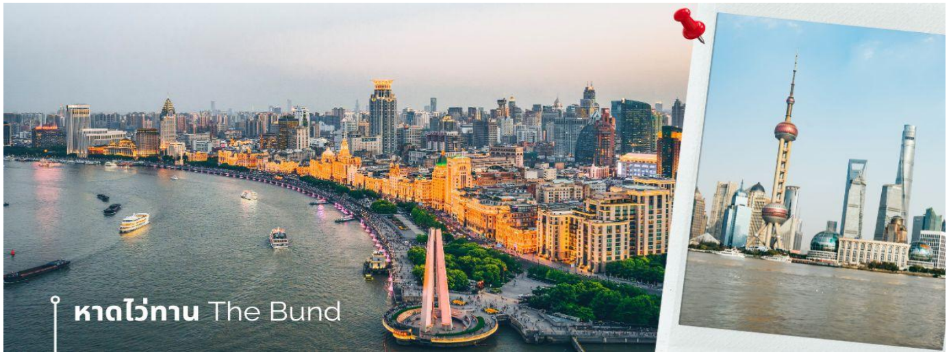
ทรูทวอทอน The Bund

CTGPGV2 เชียงใต้ ตู้หยวน ช่างเหรา หุบเขาเทวดา 5วัน 4คืน ไทยแอร์เวย์ (TG) (Feb-May25)