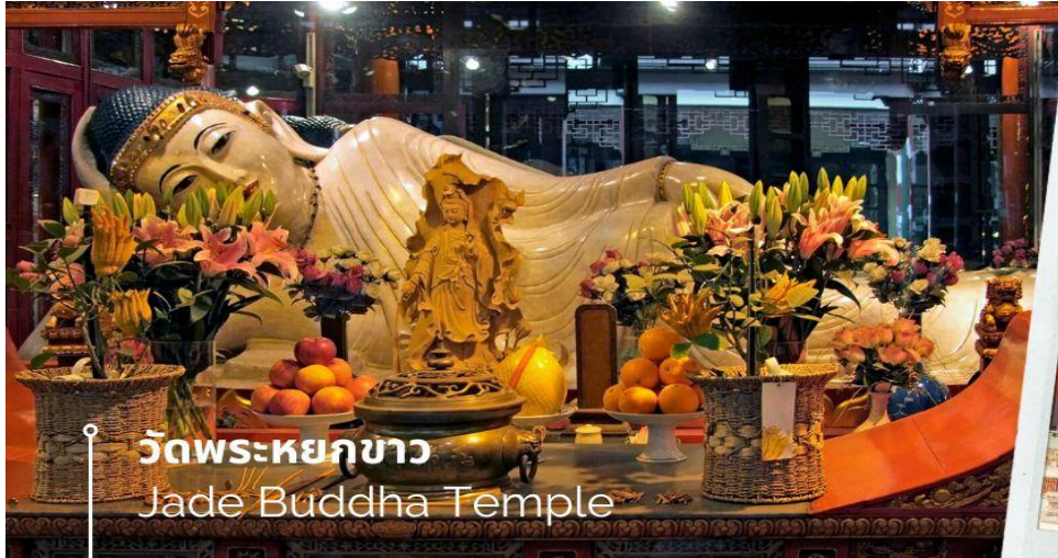
วัดพระหยกขาว Jade Buddha Temple

เช้า 10) รับประทานอาหารเช้า ณ ห้องอาหารโรงแรม (12) นำท่านชม วัดพระหยกขาว เป็นวัดที่มีชื่อเสียงมากที่สุดในเมืองเชียงใหม่ ซึ่งเป็นที่รู้จักจากพระพุทธรูปสององค์ที่สร้างขึ้นจากหยกทั้งแท่ง องค์พระพุทธรูปปางหนึ่งมีความสูง 190 เซนติเมตร และ หุ้มด้วยเพชรพลอย หิน มโนรา และ มรกต และองค์พระพุทธรูปปางไสยาสน์ มีความยาว 96 เซนติเมตร นอนเอียงด้านขวาและหนุนพระเศียรด้วยพระหัตถ์ขวา ถือเป็นวัดที่มีทั้งชาวจีนและนักท่องเที่ยวเดินทางมาสักการบูชาตลอดทั้งวันจากนั้น