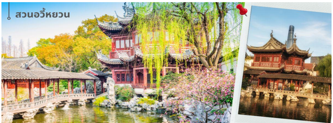
สวนอวี๋หยวน

นำท่านเดินทางสู่ สวนอวี๋หยวน เป็นสวนที่ตกแต่งตามสไตล์จีน มีต้นไม้และดอกไม้บานาชนิดที่จัดเรียงไว้อย่างสวยงามและเป็นระเบียบ มีศาลาที่ตั้งอยู่ใจกลางน้ำ ร้านขายของต่างๆ มีมุมสวยๆ ให้ได้ถ่ายรูปมากมาย และยังสามารถสัมผัสวัฒนธรรมความ