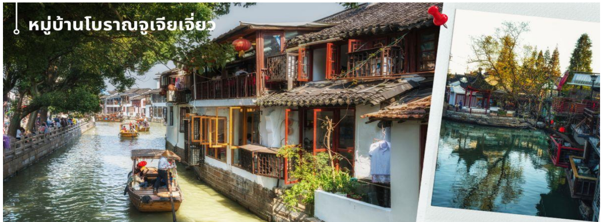
หมู่บ้านโบราณจูเจียวเจียว

นำท่านเดินทางสู่ หมู่บ้านโบราณจูเจียวเจียว มีฉายาว่า เวนชตะวันตกแห่งเมืองเชียงไฮ้ เป็นอีกหนึ่งย่านเก่าริมน้ำที่มีชื่อเสียงในเชียงไฮ้ มีประวัติศาสตร์ยาวนานกว่า 1700 ปี ซึ่งพื้นที่ทั้งหมดได้รับการอนุรักษ์ไว้เป็นอย่างดี จุดเด่นของเมืองโบราณแห่งนี้คือพื้นที่ด้านในนั้นมีแม่น้ำหลากหลายสายเชื่อมโยงไปยังพื้นที่ต่างๆ โดยรอบ ทำให้มีบรรยากาศที่สวยงามและร่มรื่น และให้ท่าน ล่องเรือ ชมวิวบ้านเรือนเก่าแก่ริมน้ำ