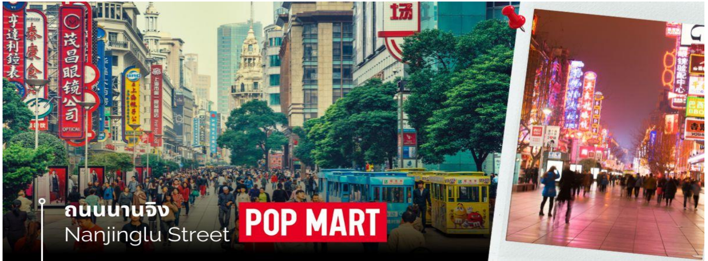
ถนนนานจิง Nanjinglu Street POP MART

และนำท่านช้อปปิ้งย่าน ถนนนานจิง Nanjinglu Street ศูนย์กลางสำหรับการช้อปปิ้งที่คึกคักมากที่สุดของนครเชียงใหม่ เชียงไฮ้ รวมทั้งห้างสรรพสินค้าใหญ่ชื่อดังกว่า 10 ห้าง และช้อปปิ้ง ร้าน POP MART สุดฮิตในขณะนี้เพื่อเป็นของฝากที่ระลึกให้แก่ญาติสนิทมิตรสหาย