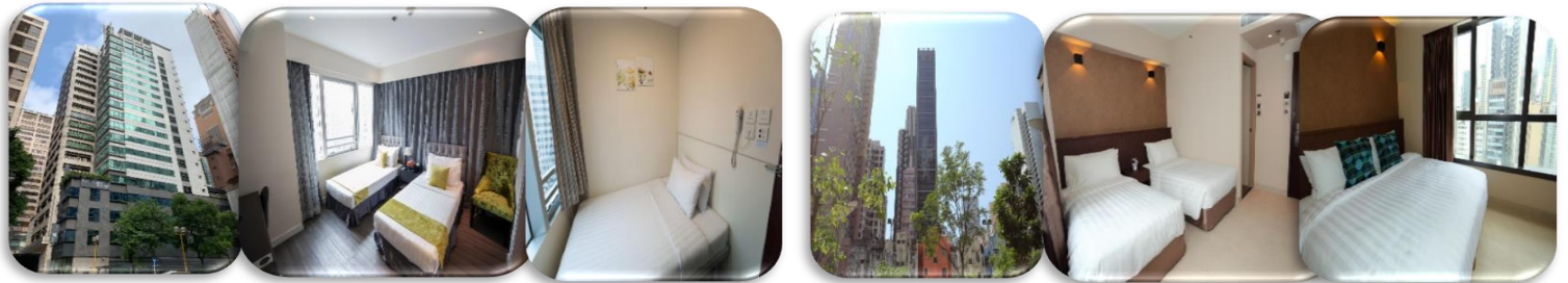
BRIDAL TEA HOURS HOTEL โรงแรมระดับ ☆☆☆ หรือเทียบเท่า