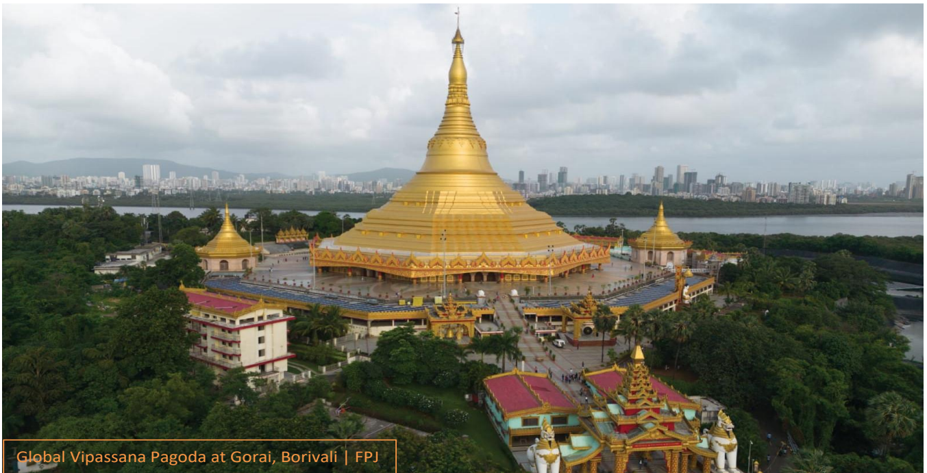
Global Vipassana Pagoda at Gorai, Borivali

(กรุณาใส่ใจ กางเกงขา สั้น ) นำท่านชม วิหารท่านโกเอ็นก้า สร้างขึ้นเมื่อปี พ.ศ.2517 ตามพลังศรัทธาชาวฮินดู ผู้ เลื่อมใสในพระพุทธศาสนา สถาบันวิปัสสนานานาชาติ Global Vipassana Pagoda "ธรรมคีรี" ที่เมืองอิกัตปური ใกล้ๆ กับเมืองบอมเบย์ เจดีย์นี้เปิดอย่างเป็นทางการโดยประ ติภา ปาฐील ประธานาธิบดีแห่งประเทศอินเดียในขณะนั้น เมื่อ 8 กุมภาพันธ์ 2009 ที่ดินที่สร้างนั้นเป็นที่ดินบริจาคอยู่บนแหลมระหว่างอ่าวเล็กโคโรทา นโกเอ็นก้าเริ่ม เดินทางไปเผยแผ่วิปัสสนาตามประเทศต่างๆ ทั่วโลก ท่านได้อำนวยการสอนวิปัสสนา หลักสูตร 10 วันในประเทศอินเดียและประเทศอื่นๆ รวมถึงมีสถานปฏิบัติธรรม มากมายที่ประเทศไทย ทั้งในซีกโลกตะวันตกและตะวันออกกว่า 400 หลักสูตร หลักการสอนของท่านโกเอ็นก้าได้รับการยอมรับโดยทั่วไป ทั้งในอินเดีย ประเทศที่ ยังคงมีความแตกต่างทางด้านชนชั้นและศาสนาอย่างมาก และจากทั่วโลก ทั้งนี้ เพราะคำสอนที่มีลักษณะเป็นสากล มิได้ขัดต่อหลักศาสนาใด ท่านเน้นเสมอว่ามนุษย์ ทุกคน ไม่ว่าจะเชื่อชาติใด นับถือศาสนาใด และมีผิวสีอะไร ต่างก็มีความทุกข์ใน รูปแบบเดียวกันทั้งสิ้น ในเมื่อความทุกข์ของมนุษย์เป็นสากล วิธีการปฏิบัติเพื่อให้พ้น จากความทุกข์จึงต้องเป็นสากลเช่นกัน