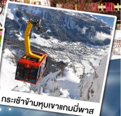
กระเช้าข้ามหุบเขาเกมมีพาส