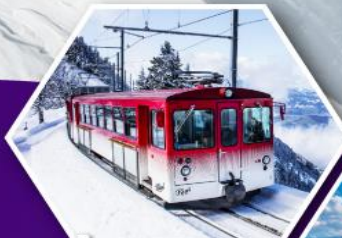
นั่งรถไฟใต้เขาริกิ