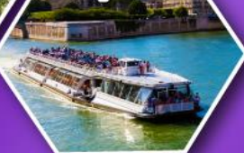
ล่องเรือบาโตมุช ชมกรุงปารีส

เที่ยวเมืองวาอุซ เมืองหลวงของสาธารณรัฐ ลิกเทินสไตน์