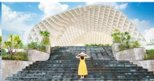
สวนเอเปก