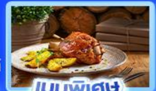
เมนูพิเศษ ขาหมูเยอรมัน