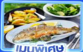
เมนูพิเศษ ปลาเทราต์ย่าง

อัลสส์ตีทท์ เวียนนา อินส์บรุค ปราสาทนอยชวานสไตน์ ลูเซิร์น ริก