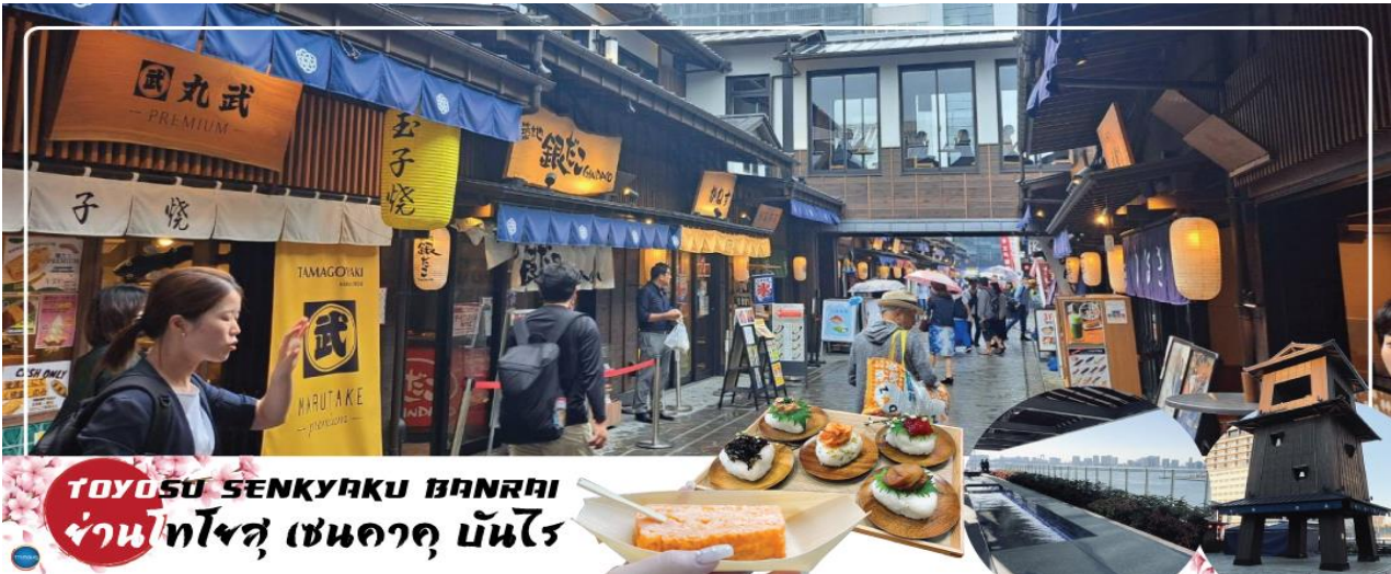
TOYOSU SENKYAKU BANRAI ย่านโทโยสุ เซนคาคุ บันไร

จากนั้นนำท่านสู่ ย่านโทโยสุ เซนคาคุ บันไร (Toyosu Senkyaku Banrai) (ใช้เวลาเดินทางประมาณ 25 นาที) เป็นสถานที่ท่องเที่ยวใหม่ที่ตั้งอยู่ในย่าน Toyosu ของ Tokyo ที่เป็นเหมือนตลาดในธีมย้อนยุคสมัยเอโดะ เปิดให้บริการในวันที่ 1 กุมภาพันธ์ 2024 โดยมีทั้งตลาด อาหาร และสถานบันเทิง นอกจากนี้ยังมีออนเซ็น 24 ชั่วโมงที่ช่วยให้เราผ่อนคลายอีกด้วย เป็นตลาดที่มีทั้งอาหารทะเลสดใหม่จาก Toyosu Market และอาหารญี่ปุ่นหลากหลายชนิด เช่น ซูชิ เทมปุระ และราเมน ที่นี้มีร้านค้าจำนวนมากที่ขายของที่ระลึกและวัตถุดิบตามฤดูกาล นอกจากนี้ยังมีจุดออนเซ็นแช่เท้า (ฟรี) ที่ยังชมบรรยากาศของโตเกียวได้อีกด้วย