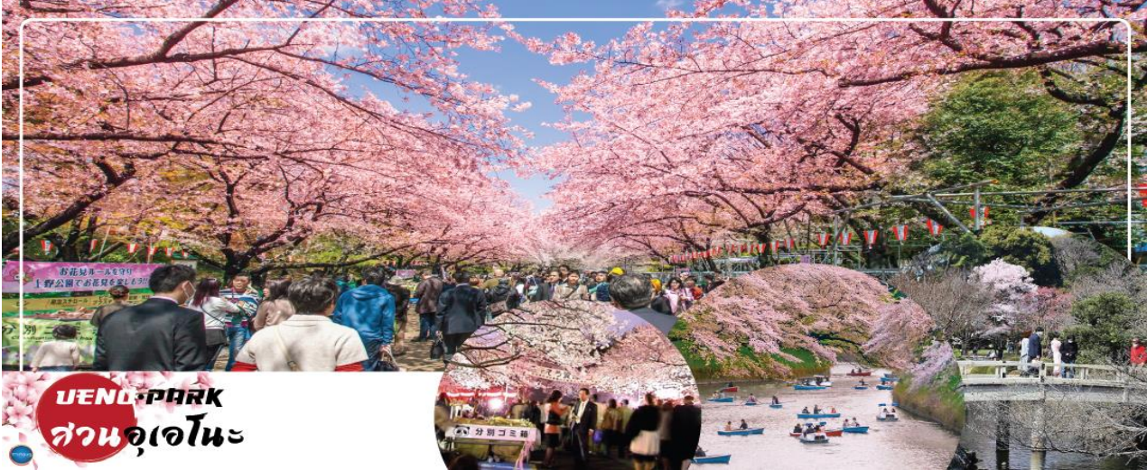
UENO PARK สวนอุเอโนะ

วันที่สี่ เมืองนาริตะ – กรุงโตเกียว – สวนอุเอโนะ (จุดชมซากุระขึ้นกับภูมิอากาศ) – โทโยสุ เซนเคียวค บันไร – ย่านโอไดบะ – ห้างไดเวอร์ซิตี – เมืองนาริตะ – อีออน มอลล์