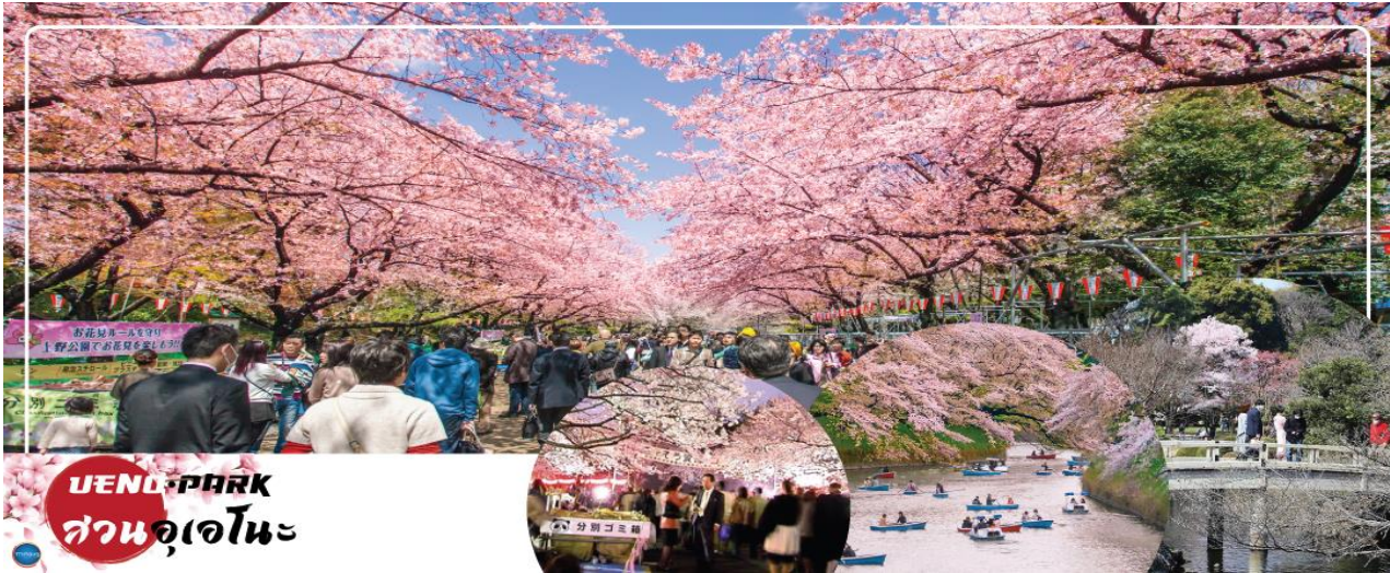
UENO PARK สวนอุเอโนะ

วันที่สี่ เมืองนาริตะ – กรุงโตเกียว – สวนอุเอโนะ (จุดชมซากุระขึ้นกับภูมิอากาศ) – โทโยสุ เซนเคียวค บันไร – ย่านโอไดบะ – ห้างไดเวอร์ซิตี – เมืองนาริตะ – อีออน มอลล์