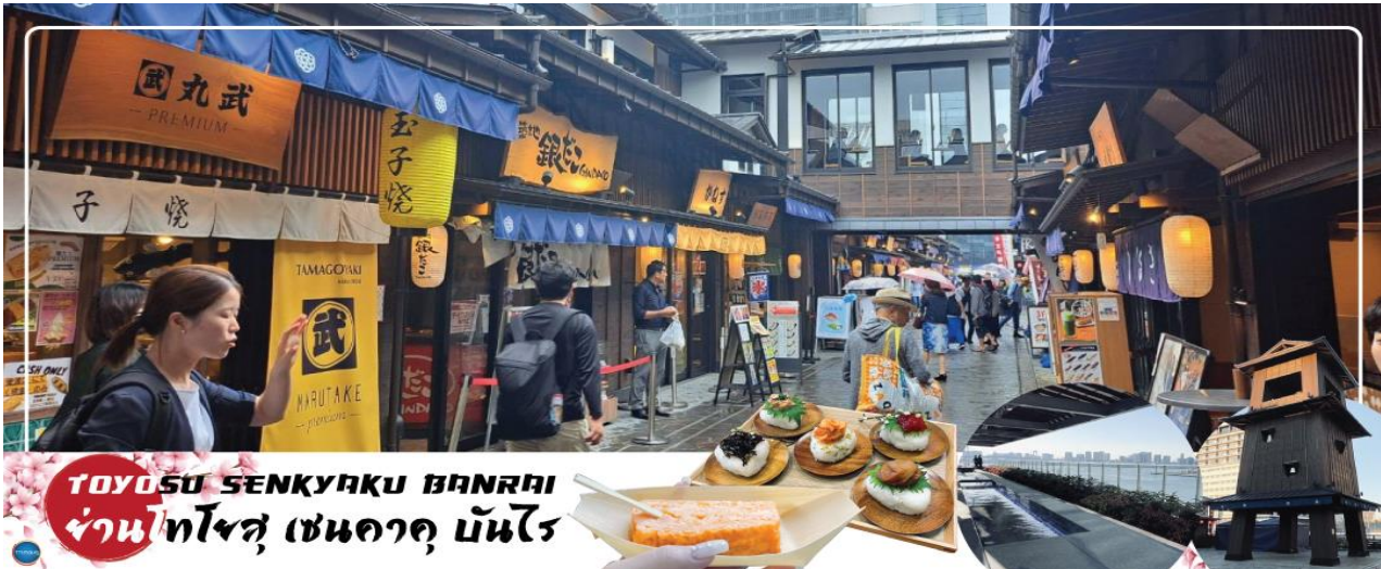
TOYOSU SENKYAKU BANRAI ย่านโทโยสุ เซนคาคุ บันไร

จากนั้นนำท่านสู่ ย่านโทโยสุ เซนคาคุ บันไร (Toyosu Senkyaku Banrai) (ใช้เวลาเดินทางประมาณ 25 นาที) เป็นสถานที่ท่องเที่ยวใหม่ที่ตั้งอยู่ในย่าน Toyosu ของ Tokyo ที่เป็นเหมือนตลาดในธีมย้อนยุคสมัยเอโดะ เปิดให้บริการในวันที่ 1 กุมภาพันธ์ 2024 โดยมีทั้งตลาด อาหาร และสถานบันเทิง นอกจากนี้ยังมีออนเซ็น 24 ชั่วโมงที่ช่วยให้เราผ่อนคลายอีกด้วย เป็นตลาดที่มีทั้งอาหารทะเลสดใหม่จาก Toyosu Market และอาหารญี่ปุ่นหลากหลายชนิด เช่น ซูชิ เทมปุระ และราเมน ที่นี้มีร้านค้าจำนวนมากที่ขายของที่ระลึกและวัตถุดิบตามฤดูกาล นอกจากนี้ยังมีจุดออนเซ็นแช่เท้า (ฟรี) ที่ยังชมบรรยากาศของโตเกียวได้อีกด้วย