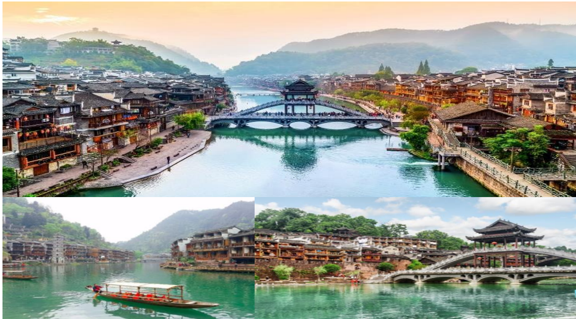
ของชนเผ่าพื้นเมืองที่อาศัยอยู่บริเวณชุมชนนี้มาช้านาน ชมสะพานหงเดียวหรือ สะพานสายรุ้ง สะพานไม้เก่าแก่ ได้รับการขนานนามว่าเวนิสเมืองจีน ตึ่มดำ