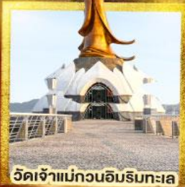
วัดเจ้าแม่กวนอิมริมทะเล