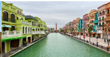
เมก้าแกรนด์เวิลด์ฮานอย