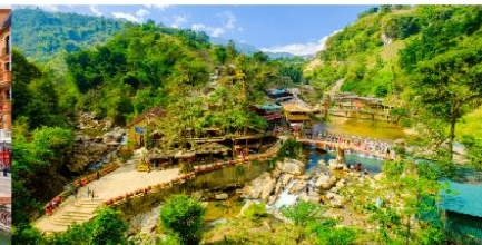
หมู่บ้านก๊อต ก๊อต

*ทางบริษัทฯ ขอสงวนสิทธิ์ในการสลับโปรแกรมทัวร์ตามความเหมาะสมขึ้นอยู่กับสถานการณ์หน้างาน โดยคำนึงถึงผลประโยชน์ของลูกค้าเป็นสำคัญ