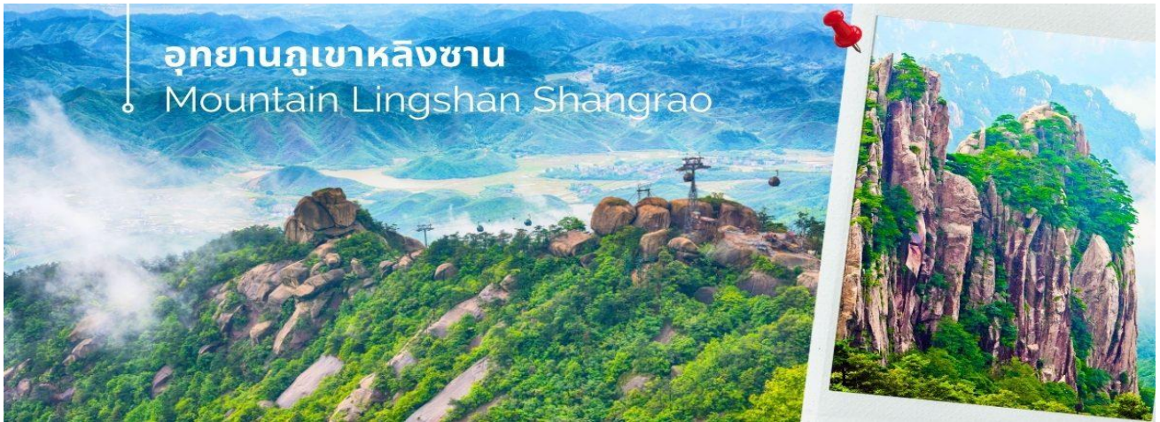
อุทยานภูเขาหลิงซาน Mountain Lingshan Shangrao

นำท่านเดินทางสู่ อุทยานภูเขาหลิงซาน ตั้งอยู่ทางตอนเหนือของประเทศจีน มณฑลช่างเหรา มีพื้นที่สวยงาม 160 ตารางกิโลเมตร หลิงซานถูกระบุว่าเป็น "หนึ่งใน 33 สถานที่ศักดิ์สิทธิ์ของโลก" โดยหนังสือลัทธิเต๋า เมื่ออากาศแจ่มใสและทัศนวิสัยดี คุณจะเห็นรูปลักษณะที่สวยงามและตั้งตรงของภูเขาหลิงซาน มีความเก่าแก่และมีมนต์ขลังมาก ไม่เพียงแต่มีภูมิทัศน์ที่สวยงาม แต่ยังมีตำนานที่ยาวนานอีกมากมาย เป็นส่วนหนึ่งของภูเขา Huaiyu ภูเขาหินสูงชัน และคดีเคียวไปทางทิศตะวันตกจนกระทั่งถึงภูเขาไปหยุนเฟิง และแบ่งออกเป็นสองส่วน ส่วนหนึ่งไปทางเหนือและอีกส่วนหนึ่งไปทางทิศตะวันตก เหมือนพระจันทร์เสี้ยวที่ฝังอยู่ในดินแดนทางตะวันออกเฉียงเหนือของมณฑลเจียงซี จากนั้นพาท่านถ่ายภาพความสวยงามของหุบเขาหลิงซาน ในจุดชมวิวกะจกห้องฟ้าที่ได้รับความนิยมจาก