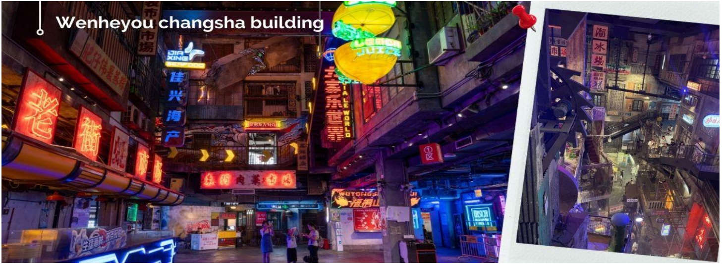
Wenheyou changsha building

CSLC1 ฉางซา-หุบเขาเทวดา-ล่องเรืออู๋หนี่โจว-รถไฟความเร็วสูง 6 วัน 5 คืน บิน Lion Air (SL)