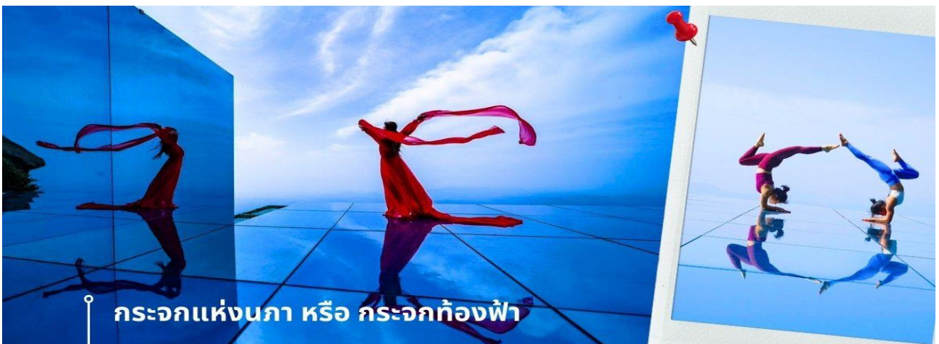
กะจกแห่งนภา หรือ กะจกห้องฟ้า

นักท่องเที่ยวจำนวนมาก นั่นคือ กะจกแห่งนภา หรือ กะจกห้องฟ้า เป็นจุดที่ท่านจะได้ เก็บภาพประทับใจของหุบเขาหลิงซานในมุมที่แปลกตา และน่าตื่นตื้น ด้วยมีลักษณะที่เป็นกะจกเงาสะท้อนตัดกับเส้นขอบฟ้า และภูเขา ถึงทำให้เกิดภาพที่น่ามหัศจรรย์