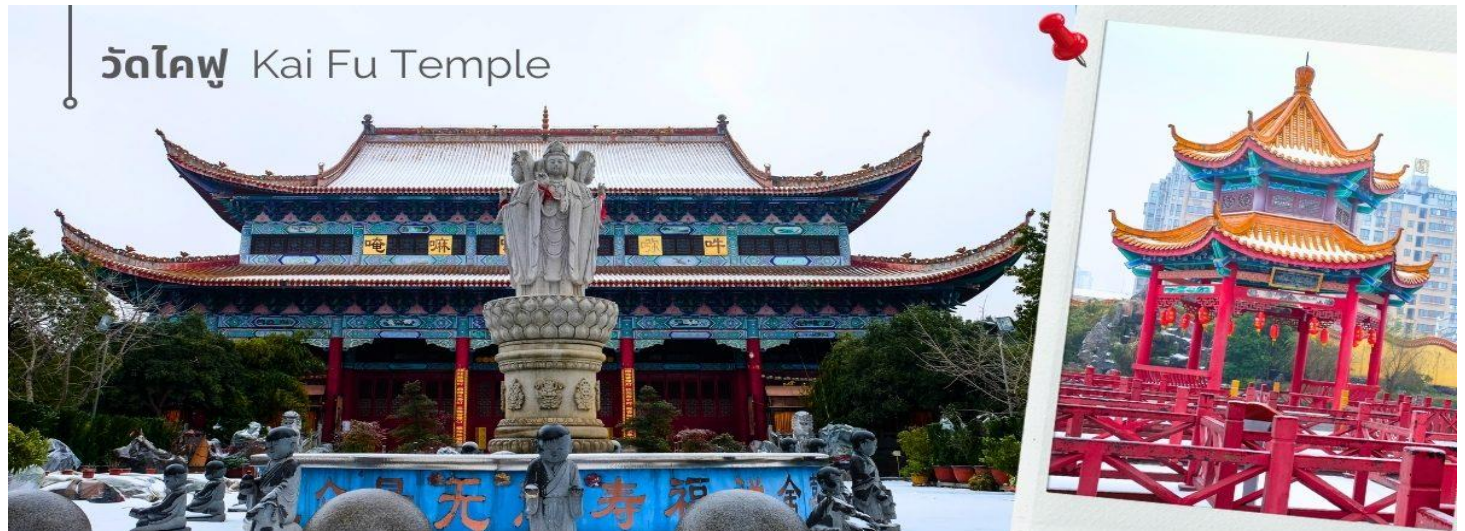
วัดไคฟู Kai Fu Temple

นำท่านชม วัดไคฟู วัดพุทธนิกายเซนเก่าแก่ ประจำเมืองฉางซา สร้างขึ้นในสมัยราชวงศ์ถัง มีอายุกว่า 1,300 ปี ภายในวัดมีสถาปัตยกรรมสไตล์จีนโบราณ ประติมากรรม และภาพจิตรกรรมฝาผนัง สามารถมาชมความสวยงามของสถาปัตยกรรม เรียนรู้วัฒนธรรม และกราบไหว้พระ ขอพรได้ บรรยากาศโดยรอบมีต้นไม้ สระน้ำ ช่วยเพิ่มความร่มรื่น มีความเงียบสงบ เหมาะแก่การมาเดินเล่นพักผ่อนหย่อนใจ