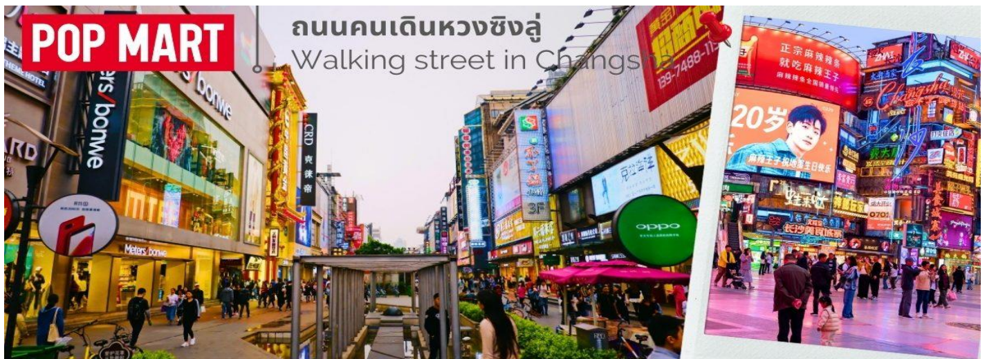
ถนนคนเดินหวงชิ่งลู่ Walking street in Changsha

จากนั้นให้ท่านได้เพลิดเพลินกับ ถนนคนเดินหวงชิ่งลู่ (Walking street in Changsha) เป็นถนนคนเดินที่ใหญ่และยาวที่สุดในฉางซา อีกทั้งเป็นแหล่งของกิน ร้านอาหาร เสื้อผ้า รองเท้า เครื่องสำอางรวมถึงของฝากของที่ระลึกอีกด้วย ช่วงเย็นจะคึกคักเป็นพิเศษ ที่มีร้านค้ามากมาย เหมาะสำหรับการเดินเล่น ช้อปปิ้ง ทานอาหาร มีเมนูแปลกๆ ให้นักท่องเที่ยวได้ลองด้วย เช่น แมงมุมทอด ม้าน้ำเสียบไม้ แมงป่องย่าง เรียกได้ว่าเปิดประสบการณ์ใหม่ๆ สำหรับใครที่อยากทานเมนูแปลกๆ และสำหรับท่านที่ซื้อช้อปปิ้งสินค้า POPMART ท่านสามารถใช้เวลาได้เต็มที่กับการเลือกชม เลือกซื้อสินค้าจากร้าน POPMART