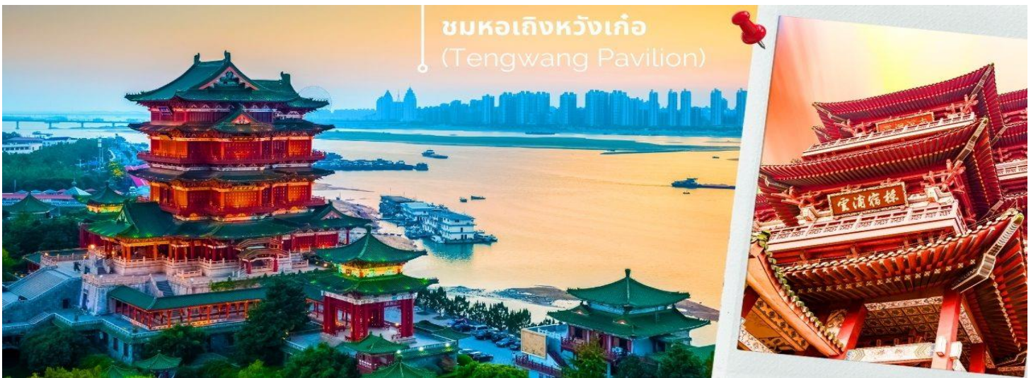
ชมหอเถิงหวังเก้อ (Tengwang Pavilion)

เช้า 📍 รับประทานอาหารเช้า ณ ห้องอาหารของโรงแรมที่พัก (2) ออกเดินทาง สู่เมืองหนานซาง โดยใช้เวลาเดินทางประมาณ 4-5 ชั่วโมง ชมหอเถิงหวังเก้อ (ถ่ายรูปด้านนอก) เถิงหวางเก้อตั้งอยู่ที่ริมแม่น้ำกานเจียงเริ่มสร้างเมื่อปี ค.ศ.635 สมัยราชวงศ์ถัง โดย ลี ยวนยিং น้องชายของจักรพรรดิ