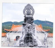
วัดฟูโกว