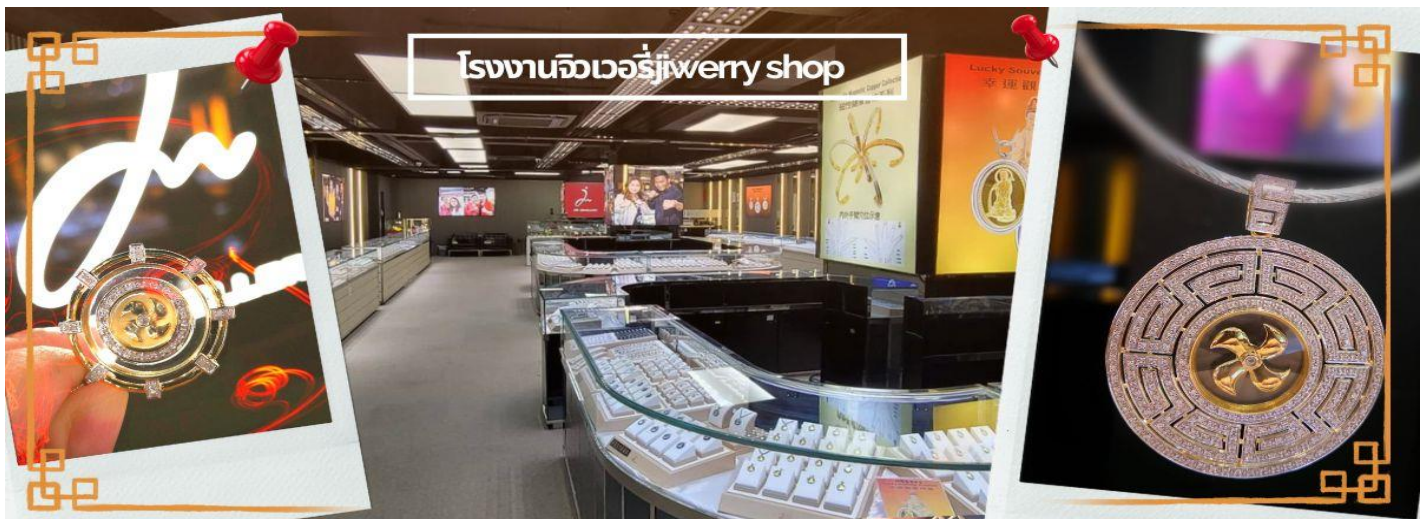
โรงงานจิวเวอรี่jewelry shop

จากนั้นนำท่านชม โรงงานจิวเวอรี่ ซึ่งเป็นโรงงานที่มีชื่อเสียงที่สุดของฮ่องกงในเรื่องการออกแบบเครื่องประดับ อาทิเช่น จี้ และแหวนกำหั้น ที่สวยงามโดดเด่นไม่เหมือนใคร ซึ่งถือกำเนิดขึ้นที่นี่และมีชื่อเสียงที่สุดใช้เครื่องประดับติดตัว และเสริมดวงชะตา สินค้าทุกชิ้นมีเอกสารรับประกันคุณภาพเปลี่ยน ซ่อม ใต้ตลอดอายุการใช้งาน หากเกิดการชำรุดจากสินค้าไม่ใช่อุบัติเหตุ