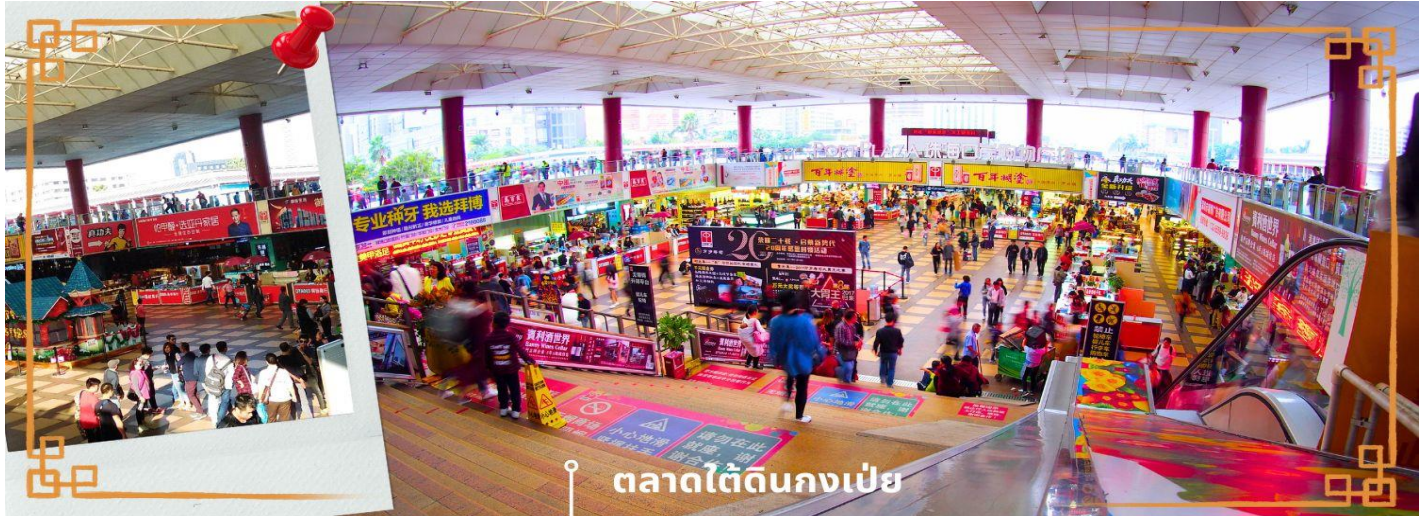
ตลาดใต้ดินกงเป๋ย

จากนั้นนำท่าน อิสระช้อปปิ้งตลาดใต้ดินกงเป๋ย ตั้งอยู่ติดชายแดนมาเก๊า เป็นศูนย์การค้าติดแอร์ ที่มีร้านค้ามากกว่า 5,000 ร้านค้า มีสินค้าให้ท่านเลือกมากมาย เช่น สินค้าก๊อปปี้แบรนด์เนมต่างๆ ไม่ว่าจะเป็นเสื้อผ้า รองเท้า กระเป๋า นาฬิกา ของเด็กเล่น ฯลฯ ที่มีสินค้าให้เลือกซื้อหลากหลาย จึงเป็นที่นิยมมากของชาวมาเก๊า และฮ่องกง เนื่องจากสินค้าที่นี่มีคุณภาพและราคาถูก