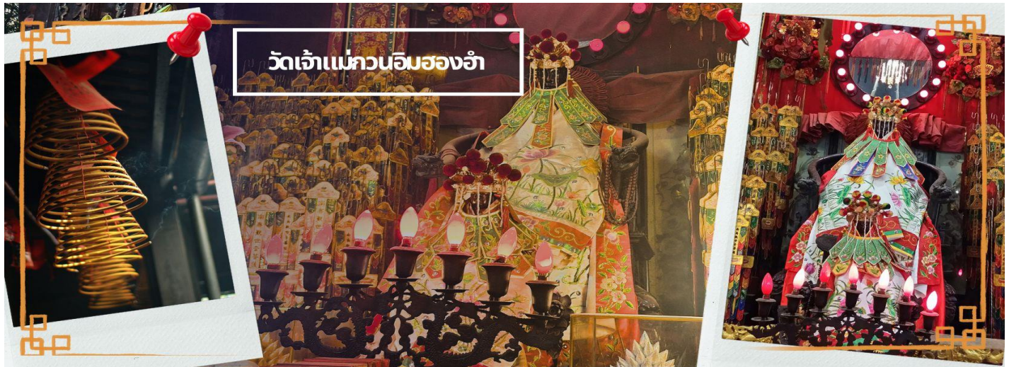
วัดเจ้าแม่กวนอิมของอ้า

CHBH5 ชื่องง-มาแก้ว-जूให้ 4 วัน 2 คืน บิน Greater Bay Airlines (HB)