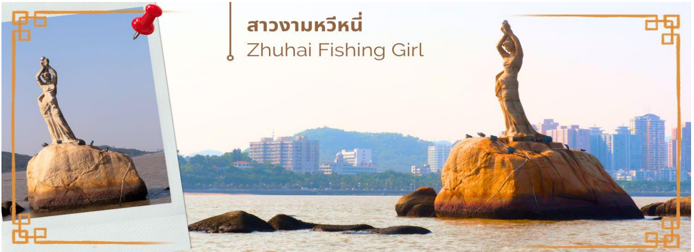
สาวงามหวีหนี่ Zhuhai Fishing Girl

CHBHS ชั่งกง-มาเก๊า-จูไห่ 4 วัน 2 คืน บิน Greater Bay Airlines (HB)