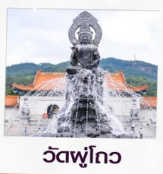
วัดฟูโกว