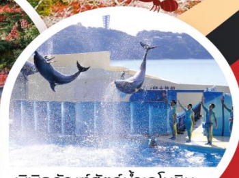
พิพิธภัณฑ์สัตว์น้ำเอโนชิมะ