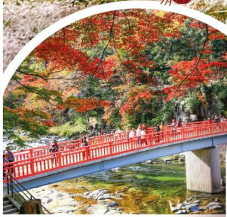
หุบเขาโครังเค