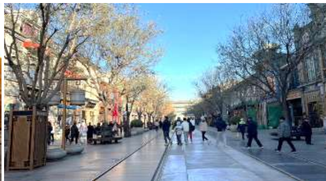
กลางวัน รับประทานอาหารกลางวัน ณ ภัตตาคาร (มือที่ 2)