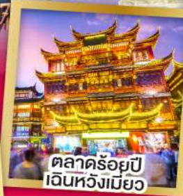
ตลาดร้อยปี เจินหวงเมียว