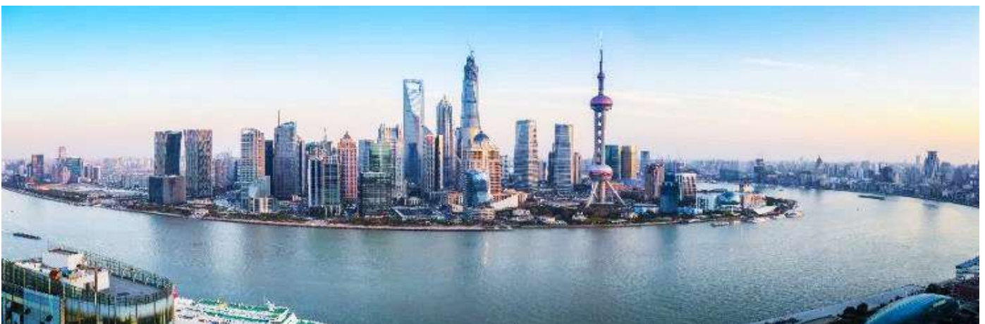
GO1PEK-CA011 ตะลอนบกก้ง-เซี่ยงไฮ้ Universal Studio Beijing + Shanghai Disneyland 6 วัน 4 คน โดยสายการบิน Air China (CA)

นำท่านสู่บริเวณ หาดไว่ทาน ตั้งอยู่บนฝั่งตะวันตกของแม่น้ำหวงผู้มีความยาวจากเหนือจรดใต้ถึง 4 กิโลเมตร ถือเป็นสัญลักษณ์ที่โดดเด่นของนครเซี่ยงไฮ้อีกทั้งถือเป็นศูนย์กลางทางด้านการเงินการ ธนาคารที่สำคัญแห่งหนึ่งของเซี่ยงไฮ้ตลอดแนวยาวของหาดไว่ทานเป็นแหล่งรวมศิลปะ สถาปัตยกรรมที่หลากหลาย เช่น สถาปัตยกรรมแบบโรมันโกธิคबारอครวมทั้งการผสมผสาน ระหว่างสถาปัตยกรรมตะวันออก-ตะวันตกเป็นที่ตั้งของหน่วยงานภาครัฐเช่น กรมศุลกากร โรงแรม และสำนักงานใหญ่ของธนาคารต่างชาติเป็นต้น