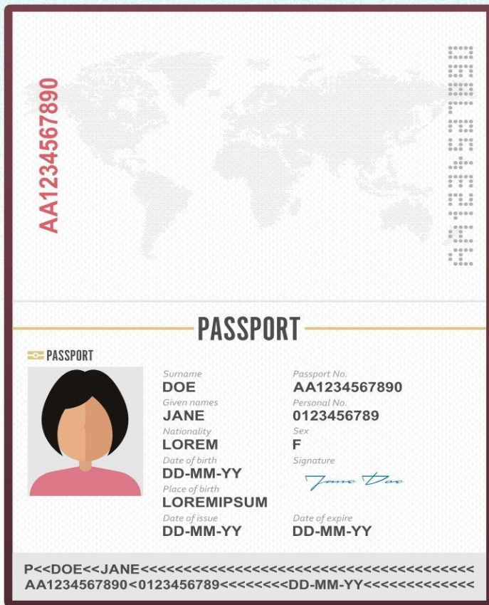
ตัวอย่างโฟล์สแกน รูปถ่าย