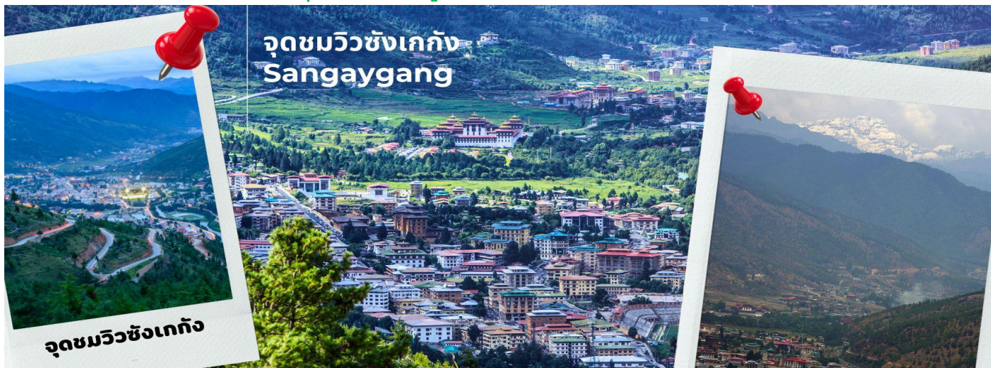
จุดชมวิวซังเกกัง Sangaygang

นำท่านชม จุดชมวิวซังเกกัง (Sangaygang) จุดชมวิวทิวทัศน์ที่สวยงามของหุบเขาเมืองทิมพู เพื่อเก็บภาพประทับใจ จากนั้นนำทุกท่านเดินทางสู่เมืองพาโร ใช้เวลาประมาณ 1 ชั่วโมง