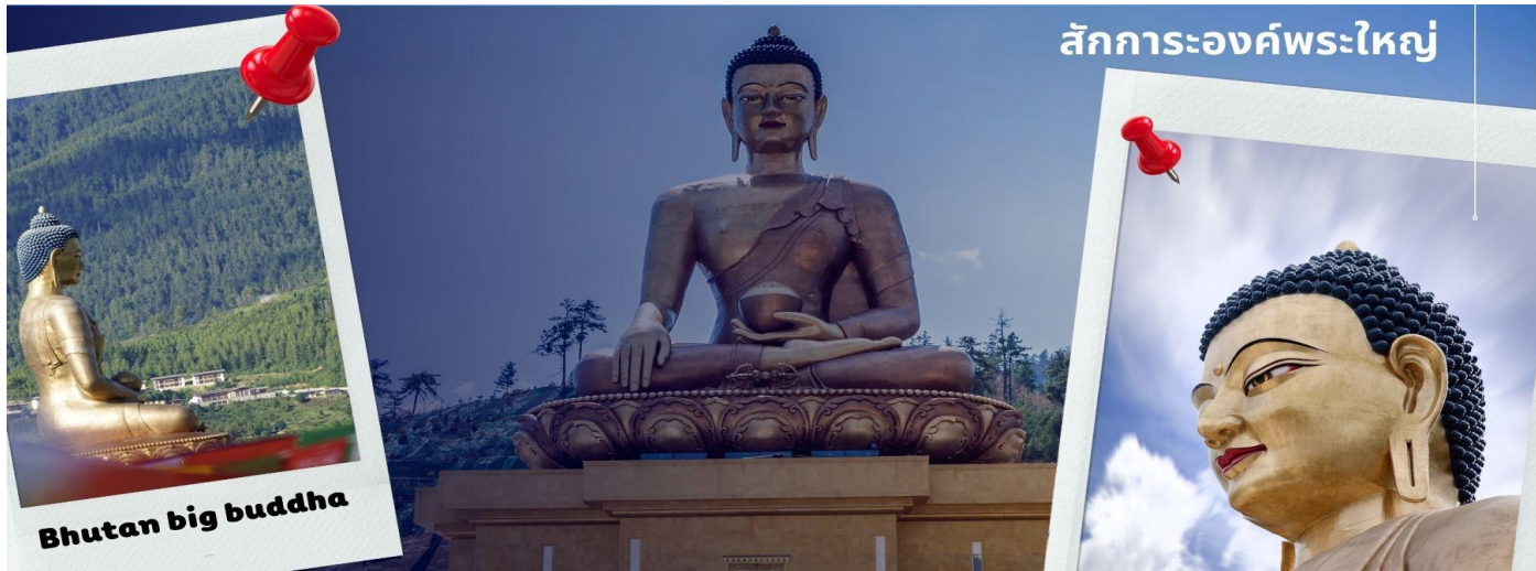
สักการะองค์พระใหญ่

นำท่าน สักการะองค์พระใหญ่ ที่ตั้งอยู่สูงที่สุดในโลก และได้รับความร่วมมือจากเศรษฐีชาวสิงคโปร์ บริจาคเงินซื้อที่ดินและสร้างพระพุทธรูป ให้แก่รัฐบาลประเทศภูฏานให้ท่านไหว้ขอพรเพื่อเป็นศิริมงคล