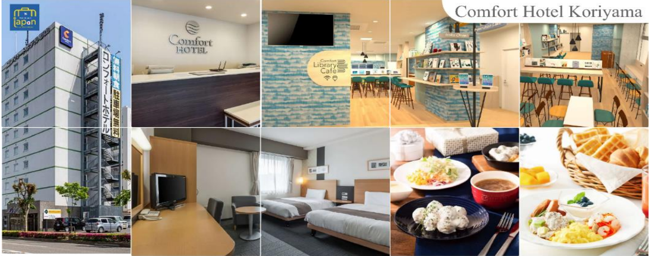
Comfort Hotel Koriyama

เย็น อิสระรับประทานอาหารเย็นตามอัธยาศัย พักที่ COMFORT HOTEL KORIYAMA หรือระดับเดียวกัน