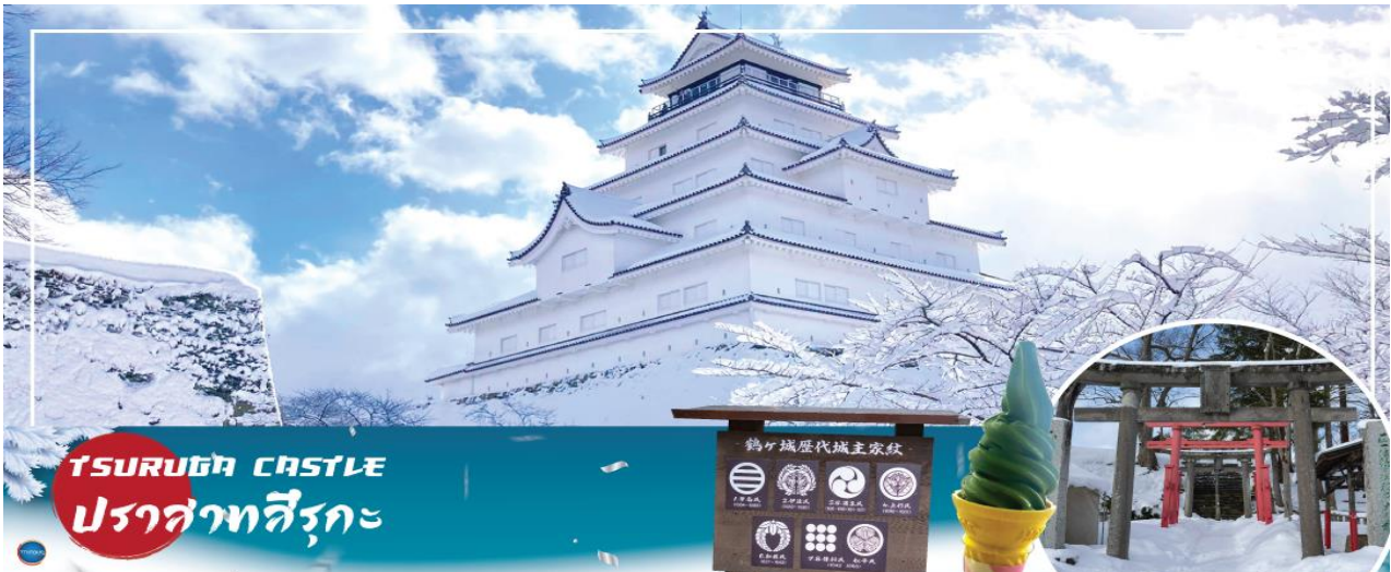
TSURUGA CASTLE ปราสาทสิรุกะ

จากนั้นนำท่านสู่ ปราสาทสิรุกะ (Tsuruga Castle) หรือ ปราสาทนกระเรียน (ด้านนอก) (ใช้เวลาเดินทางประมาณ 40 นาที) เป็นเพียงแห่งเดียวที่ยังคงเอกลักษณ์ดั้งเดิมของญี่ปุ่นไว้ ปราสาทหลังคาสีแดงอันเป็นสัญลักษณ์แห่งเมืองไอสุวาคามัทซึ ตั้งอยู่ไม่ไกลจากสถานีรถไฟไอสุวาคามัทซึ เดิมมีชื่อว่า ปราสาทคุโรคะวะ (Kurokawa Castle) สร้างขึ้นในปี ค.ศ.1384 โดยตระกูลอะชิคะ แต่เกิดแผ่นดินไหวในปี ค.ศ. 1611 ทำให้ปราสาทเสียหายหนักและได้มีการบูรณะและปรับจากปราสาท 7 ชั้น เหลือเพียง 5 ชั้นเท่านั้น ไฮไลท์!!! ปราสาทแห่งนี้ ถือเป็นอนุสรณ์สถานที่ยังทิ้งร่องรอยของเหล่านักรบซามูไรกลุ่มสุดท้ายในญี่ปุ่น ที่ได้เลือกปลิดชีพตัวเองลง ณ สถานที่นี้