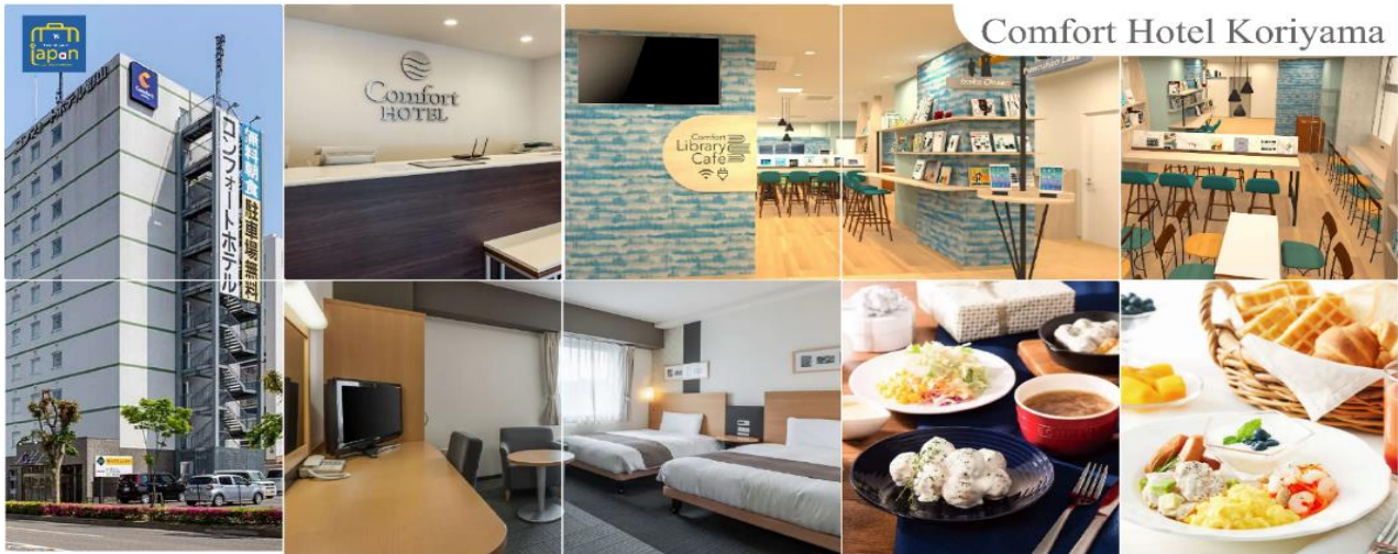
Comfort Hotel Koriyama

รับประทานอาหารเย็น ณ ภัตตาคาร (1) COMFORT HOTEL KORIYAMA หรือระดับเดียวกัน