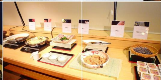
Sendai Business Hotel Ekimae