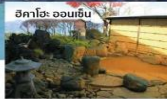
ฮิคาโอ ออนเซ็น