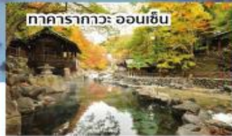
ทาคารากาวะ ออนเซ็น