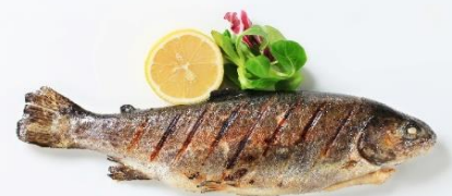
พิเศษ!! ปลาเทราต์ย่าง

นำท่านเดินทางสู่ เมืองลินซ์ (Linz) (ระยะทาง 125 กม./ 2 ชม.) เป็นเมืองที่มีการผลิตเหล็ก เครื่องจักร อุปกรณ์ไฟฟ้า อดีตเป็นศูนย์กลางการค้าที่สำคัญ ให้ท่านถ่ายรูปบริเวณด้านนอก พิพิธภัณฑ์แห่งโลกอนาคต (Ars Electronica Center) ตั้งอยู่ริมแม่น้ำดานูบ เป็นที่จัดแสดงวิทยาการต่างๆ ที่ส่งผลกระทบต่อมวล มนุษย์ปัจจุบัน ไม่ว่าจะเป็นอวกาศ หุ่นยนต์และเอไอ ยารักษาโรค เป็นต้น