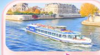
คลองเรือแม่น้ำเซน