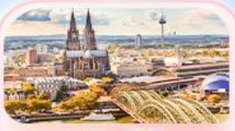
มหาวิหารโคโลญ