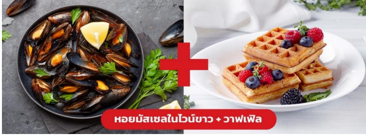
หอยมัสเซลในไวน์ขาว + วาฟเฟิล

เย็น ๑๐ รับประทานอาหารเย็น (มื้อที่10) เมนูพิเศษ!! หอยมัสเซล + วาฟเฟิล (Mussel in White wine + Waffle)