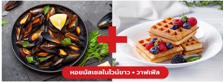
หอยมัสเซลในไวน์ขาว + วาฟเฟิล

เย็น ๑๐ รับประทานอาหารเย็น (มื้อที่10) เมนูพิเศษ!! หอยมัสเซล + วาฟเฟิล (Mussel in White wine + Waffle)