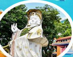
เจ้าแม่กวนอิม รัฟลีส เบย์