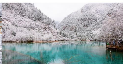
อุทยานแห่งชาติจิวจ้ายโกว

*ทางบริษัทฯ ขอสงวนสิทธิ์ในการสลับโปรแกรมทัวร์ตามความเหมาะสมขึ้นอยู่กับสถานการณ์หน้างาน โดยคำนึงถึงผลประโยชน์ของลูกค้าเป็นสำคัญ