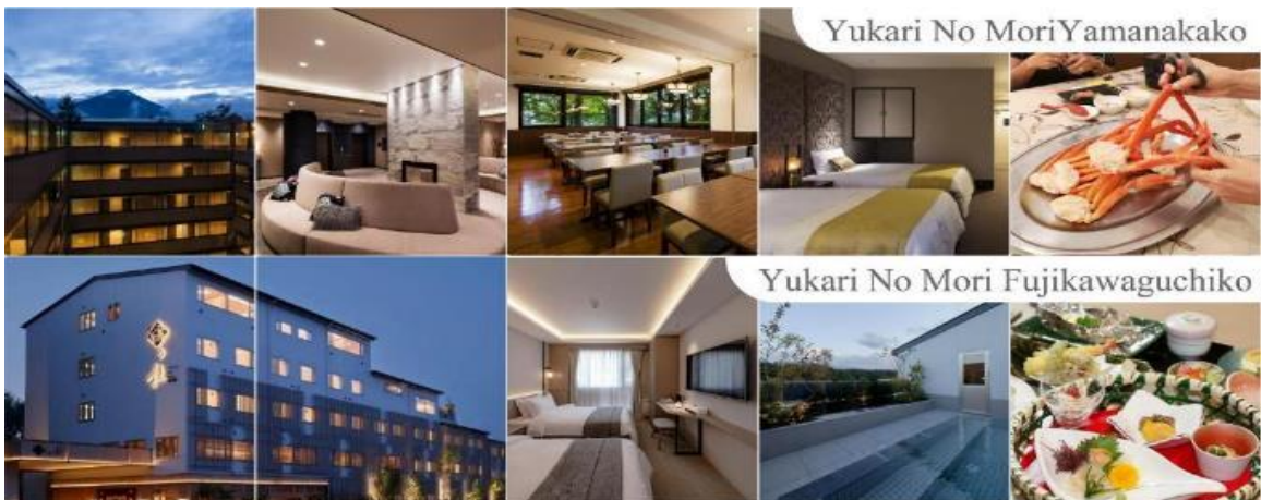
Yukari No Mori Yamanakako