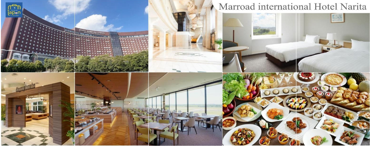
Marroad international Hotel Narita

MARROAD INTERNATIONAL HOTEL NARITA หรือเทียบเท่าระดับเดียวกัน