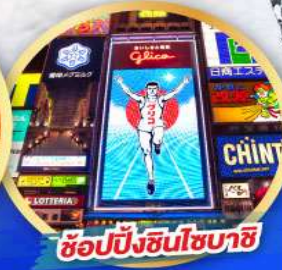
ซั๊ปปิ้งชินโซบาชิ

เดินทาง 14-19, 21-26 ม.ค. 68 06-11, 13-18 ก.พ. 68 13-18 มี.ค. 68