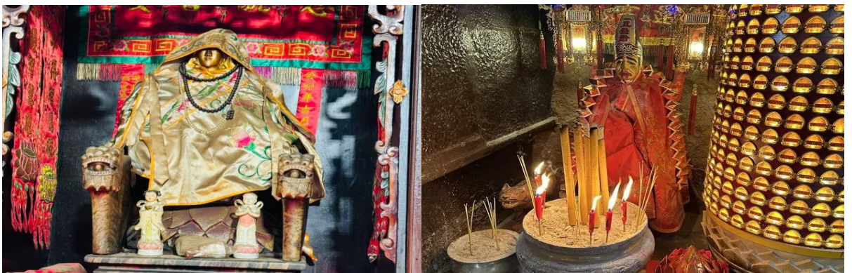
GO1HKG-EK046 อ่องกง มุสตุบึง รีฟัลล์เบย์ แซงทมิว เจ้าแม่กวนอิมอ่องฮำ ซ้อบปึง 3 วัน 2 คืน โดยสายการบิน Emirates (EK)

จากนั้นนำท่านเดินทางสู่ วัดหลินฟ้า (Lin Fa Temple) หรือวังดอกบัว วัดแห่งนี้มีเจ้าแม่กวนอิมเป็นองค์ประธานของวัด โดยเคยมีตำนานเล่าว่าครั้งหนึ่ง เจ้าแม่กวนอิมเคยมาปรากฏตัวที่วัดแห่งนี้ ทำให้ชาวบ้านเลื่อมใสศรัทธา ชาวบ้านจึงรวมใจกันสร้างวิหารดอกบัว และประดับด้วยโคมดอกบัวต่างๆ เพื่อเป็นการสักการบูชา และภายในวัดยังมี เทพเจ้าฮั่วจื่อเอี้ยะ หรือ เทพเจ้าสายนรก เป็นเทพเจ้าที่ขึ้นชื่อเรื่องกตัญญู ที่เปี่ยมไปด้วยพลังหยิน ซึ่งเป็นพลังที่ขึ้นชื่อด้านเงินทองจึงเหมาะอย่างยิ่งสำหรับผู้ที่ชอบเสี่ยงโชค ให้ท่านได้สักการบูชาเสริมความเฮง