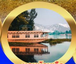
นอนบ้านเรือ วิวเขาหิมาลัย