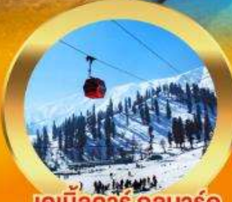
เคเบิลคาร์ กุลมาร์ค