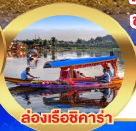
ล่องเรือซิคาร์่า