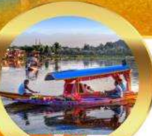
ล่องเรือซิคาร์่า