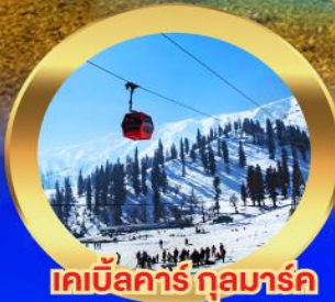
เคเบิลคาร์ กุลมาร์ค

23-28 พ.ย. 67 38,900 30 พ.ย.-05 ธ.ค. 67 40,900