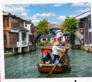
ล่องเรือจูเจียเจียว