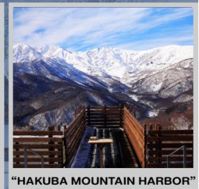
"HAKUBA MOUNTAIN HARBOR"