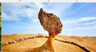
อุทยานธรณีเย่หลิว