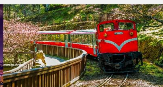
อุทยานแห่งชาติอาลีซาน