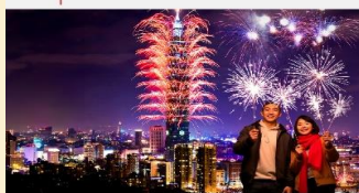
COUNTDOWN TO 2025