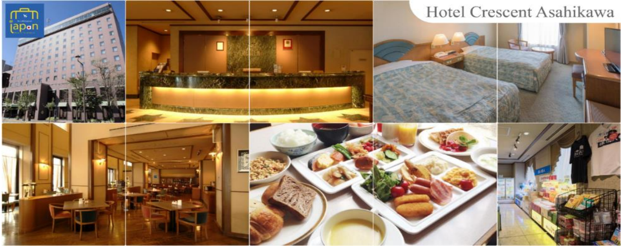
Hotel Crescent Asahikawa

ที่พัก HOTEL CRESCENT ASAHIKAWA หรือเทียบเท่าระดับเดียวกัน