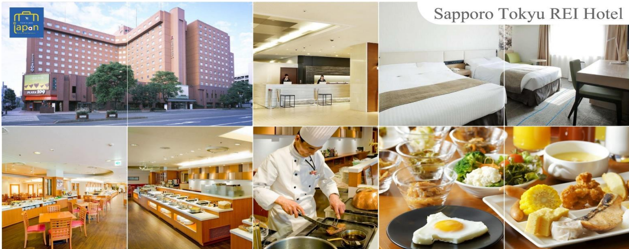
Sapporo Tokyu REI Hotel

รับประทานอาหารเย็น ณ ภัตตาคาร (6) --- พิเศษ!!! เมนู ซาซุ + ซาซุ SAPPORO TOKYU REI HOTEL หรือเทียบเท่าระดับเดียวกัน