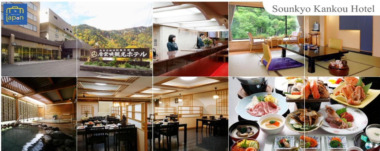
Sounkyo Kankou Hotel

หลังอาหารให้ท่านได้ผ่อนคลายกับการแช่น้ำแร่ธรรมชาติ เชื่อว่าถ้าได้แช่น้ำแร่แล้ว จะทำให้ผิวพรรณสวยงามและช่วยให้ระบบหมุนเวียนโลหิตดีขึ้น