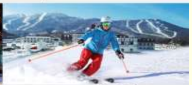
ลานสกียาปูสี

*ทางบริษัทฯ ขอสงวนสิทธิ์ในการสลับโปรแกรมทัวร์ตามความเหมาะสมขึ้นอยู่กับสถานการณ์ปัจจุบัน โดยคำนึงถึงผลประโยชน์ของลูกค้าเป็นสำคัญ