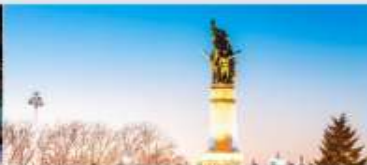
อนุสาวรีย์ผิงหง