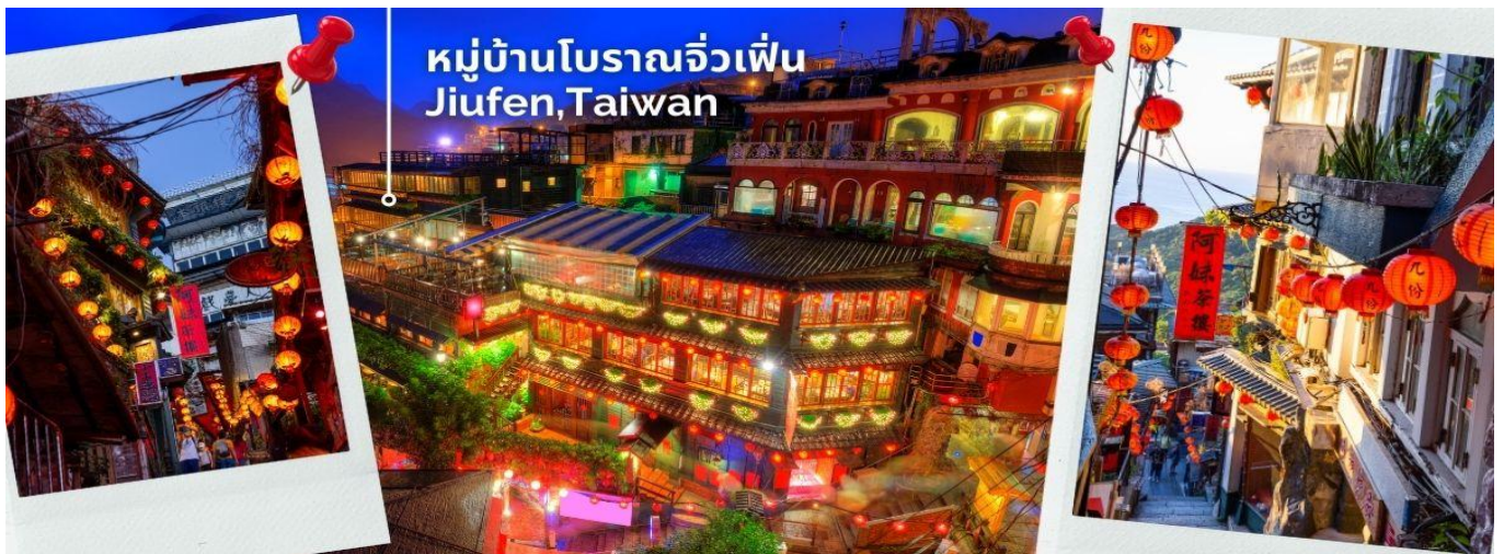
หมู่บ้านโบราณจิวเฟิ่น Jiufen, Taiwan

นำทุกท่านเดินทางไปสู่สัมผัสบรรยากาศ หมู่บ้านโบราณจิวเฟิ่น ที่ตั้งอยู่บริเวณไหล่เขาใน เมืองจีหลง หมู่บ้านจิวเฟิ่น เคยเป็นแหล่งเหมืองทองที่มีชื่อเสียงตั้งแต่สมัยโบราณ ปัจจุบันเป็นสถานที่ท่องเที่ยวที่สำคัญแห่งหนึ่ง เพราะเป็นถนนคนเดินเก่าแก่ที่มีชื่อเสียงที่สุดในไต้หวัน ให้ท่านได้เพลิดเพลินบรรยากาศแบบดั้งเดิมของร้านค้า ร้านอาหารของชาวไต้หวันในอดีตและยังสามารถชื่นชมวิวทิวทัศน์รวมทั้งเลือกชิมและซื้อชาจากร้านค้าที่มีอยู่มากมายอีกด้วย *เสาร์-อาทิตย์ ต้องเปลี่ยนเป็นรถสาธารณะ