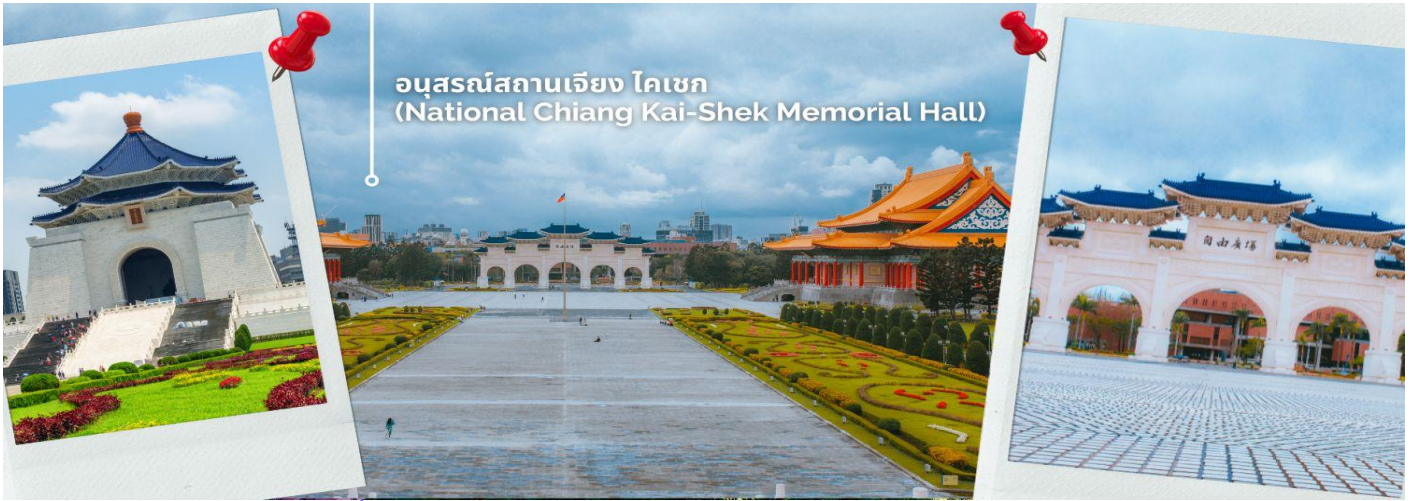
อนุสรณ์สถานเจียง ไคเชก (National Chiang Kai-Shek Memorial Hall)

ถูกสร้างขึ้นตามแบบสถาปัตยกรรมจีนโบราณ บนโด่งสี่ด้านถูกสร้างด้วยหินอ่อนสีขาวเป็นชั้นตามแบบพีระมิดอียิปต์ หลังคาสีน้ำเงิน รวมทั้งยังมีสวนดอกไม้สีแดง ที่เป็นการแสดงออกทางสัญลักษณ์ให้เห็นถึงอิสรภาพ ความเท่าเทียม และความเป็นหนึ่งเดียวกัน ตามสี่ของธงชาติไต้หวัน