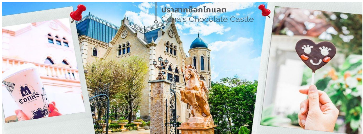
ปราสาทช็อกโกแลต Cona's Chocolate Castle

จากนั้นนำทุกท่านเดินทางสู่ ปราสาทช็อกโกแลต Cona's Chocolate Castle ซึ่งอยู่ไม่ไกลจากท่าเรือทะเลสาบสุริยันจันทรามากนัก ปราสาทช็อกโกแลตเป็นสถานที่ท่องเที่ยวไฮไลท์ของเมืองหนานโถว ตัวปราสาทสีงาช้าง เป็นสถาปัตยกรรมสไตล์อังกฤษที่สวยงามโอบล้อมด้วยสวนสไตล์อังกฤษที่ตกแต่งด้วยต้นโกโก้และดอกไม้นานาพรรณ ในสวนมีมุมพักผ่อนและมุมถ่ายภาพมากมาย และยังมีมุมสำหรับเด็กๆ ได้เล่นสนุกอีกด้วยปราสาทมีทั้งหมด 3 ชั้น ชั้นล่างสุดมีการฉายภาพ 3 มิติและฉายความรู้เชิงโต้ตอบ (interactive) มี Choco Bar จำหน่ายสินค้าจากช็อกโกแลต ของที่ระลึก และขนมแสนอร่อยในบรรจุภัณฑ์ที่สวยงามน่ารัก