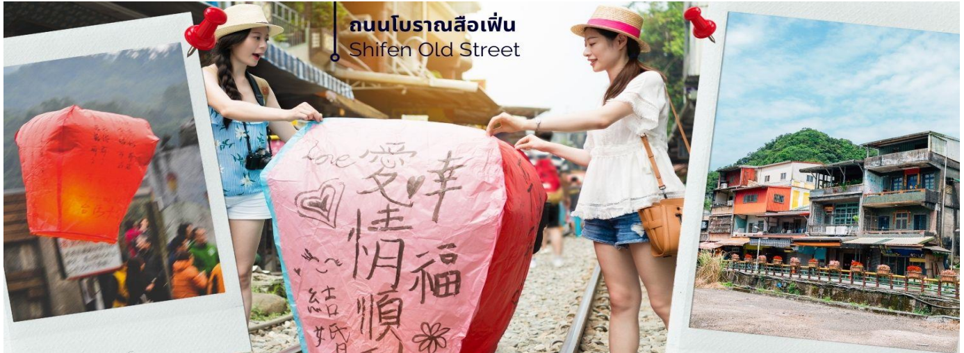
ถนนโบราณสี่เฟิ่น Shifen Old Street

จากนั้นนำท่านไป ถนนโบราณสี่เฟิ่น (Shifen Old Street) เป็นชุมชนเล็กๆ ริมทางรถไฟสายเก่าของสายรถไฟผิงซี (Ping xi Line) ถนนแห่งนี้เป็นชุมชนเก่าแก่ที่เมื่อก่อนเป็นเส้นทางลำเลียงถ่านหินสมัยที่ญี่ปุ่นยึดครองไต้หวัน นักท่องเที่ยวนิยมมาปล่อยโคมลอยกระดาษ เมื่อซื้อโคมไฟก็มีการเขียนความปรารถนาที่จะอธิษฐาน และปล่อยขึ้นท้องฟ้า และสนุกกับการเดินเล่นไปตามรางรถไฟ มีร้านอาหารและโปสการ์ดให้เลือกซื้อ ร้านขายงานฝีมือผลิตภัณฑ์โคมไฟ (รวมค่าบริการแล้วปล่อยโคมลอยแล้ว 1 โคม / 4 ท่าน)