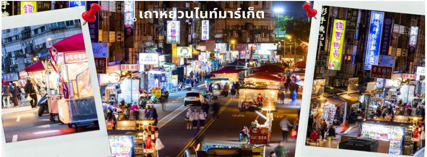
เกาหยวนไนท์มาร์เก็ต

จากนั้นนำท่านเดินทางสู่ เมืองเกาหยวน เพื่อให้ท่านช้อปปิ้ง เกาหยวนไนท์มาร์เก็ต ซึ่งเป็นถนนสายสำหรับขายอาหารเครื่องดื่มและอาหารยอดนิยมของตลาดกลางคืนไต้หวันราคาไม่แพง คุณภาพดี