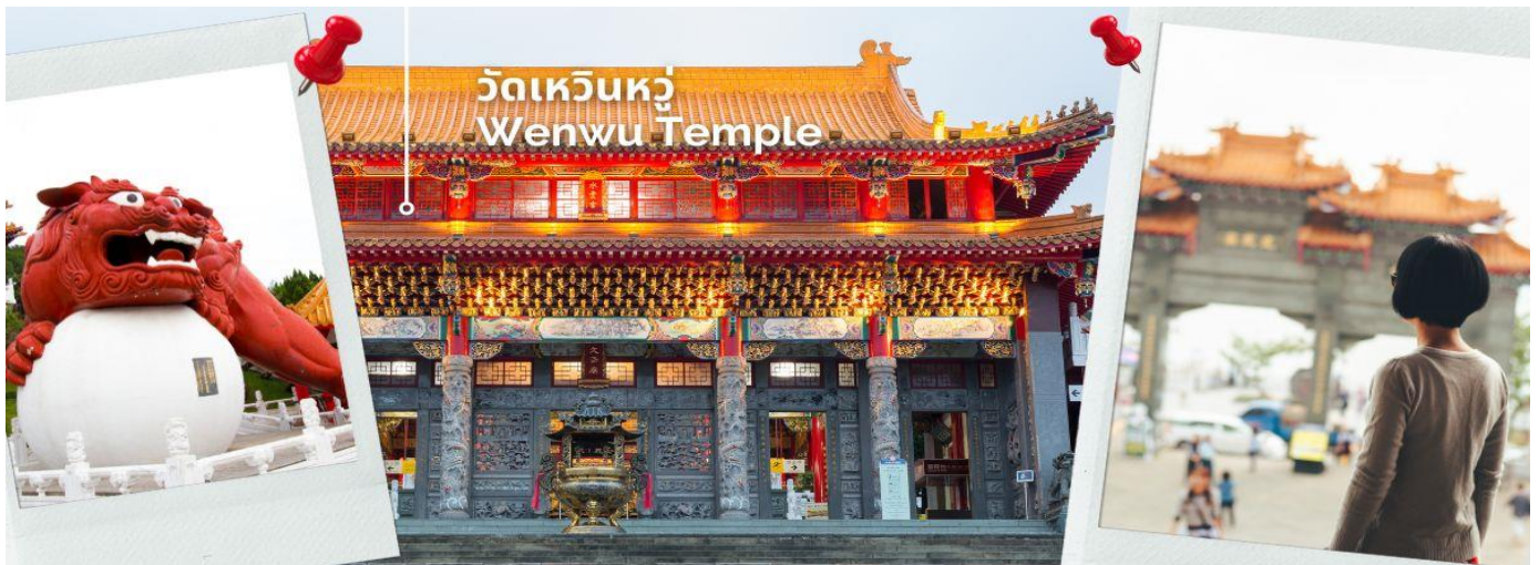
วัดเหวินหวู่ Wenwu Temple

จากนั้นนำท่านสักการะเทพเจ้ากวนอู ณ วัดเหวินหวู่ หรือ วัดกวนอู วัดแห่งนี้เป็นวัดใหม่ที่ทางการญี่ปุ่นสร้างขึ้นหลังจากทำการสร้างเงื่อนไขให้วัดเก่า 2 วัด จมอยู่ใต้เขื่อน การออกแบบของวัดเหวินหวู่โครงสร้างคล้ายกับพระราชวังกู้กง ของประเทศจีน ภายในวิหารประดิษฐานเทพเจ้ากวนอู เทพเจ้าแห่งความซื่อสัตย์และคุณธรรม การขอพรจากองค์เทพกวนอู ณ วัดเหวินหวู่ ที่วัดมีรูปปั้นของซงจือและเทพกวนอู (เทพเจ้าแห่งปัญญา และเทพเจ้าแห่งความซื่อสัตย์) ซึ่งชาวไต้หวันเชื่อกันว่า หากได้บูชาเทพเจ้ากวนอู จะได้ประสบความสำเร็จในหน้าที่การงาน มีแต่คนจงรักภักดี หรือหากวางแผนสิ่งใด ก็จะสามารถประสบความสำเร็จตามปรารถนา จึงทำให้ได้รับความนิยมจากชาวไต้หวัน ที่มาสักการะขอพรองค์เทพในวัดแห่งนี้