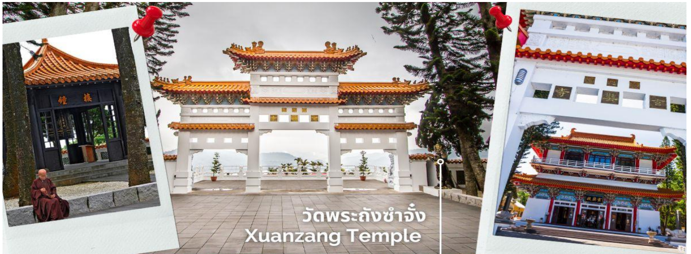
วัดพระถังซำจั๋ง Xuanzang Temple