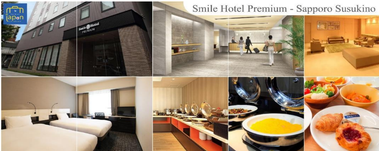
Smile Hotel Premium - Sapporo Susukino