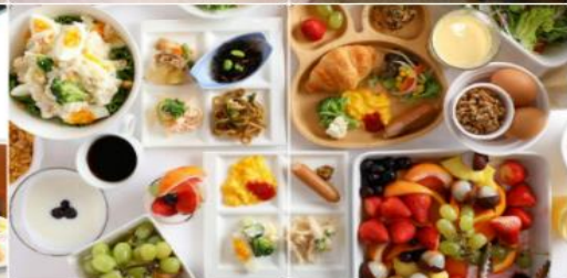
HOTEL B Suites