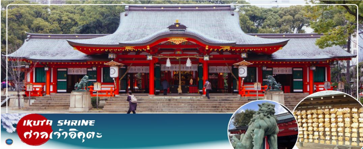
IKUTA SHRINE ศาลเจ้าอิคุตะ

จากนั้นนำท่านสักการะ ศาลเจ้าอิคุตะ (Ikuta Shrine) ตั้งอยู่ในย่านใจกลางเมืองซันโนะมียะ (Sannomiya) เป็นศาลเจ้าที่มีประวัติศาสตร์ยาวนาน ก่อตั้งในปี 201 หนึ่งในสามศาลเจ้าหลักของ โกเบที่มีประวัติศาสตร์ยาวนานกว่า 1,800 ปี ทางเหนือไปตามถนนช็องถนนอิคุตะ คุณจะเห็นทางเข้า ศาลเจ้าพร้อมประตูโทริอิที่สร้างโดยใช้วัสดุรีไซเคิลจากศาลเจ้าใหญ่อิเสะ ศาลเจ้าอิคุตะมีชื่อเสียงใน ด้านผลประโยชน์ในการจับคู่ เนื่องจากจิตอธิ อนุชนเป็นเทพเจ้าผู้ทอเสื้อผ้าของเทพเจ้า และเธอ ทอด้ายและด้ายเข้าด้วยกัน คนในพื้นที่เรียกกันอย่างเสนาหว่า "อิคุตะซัง"