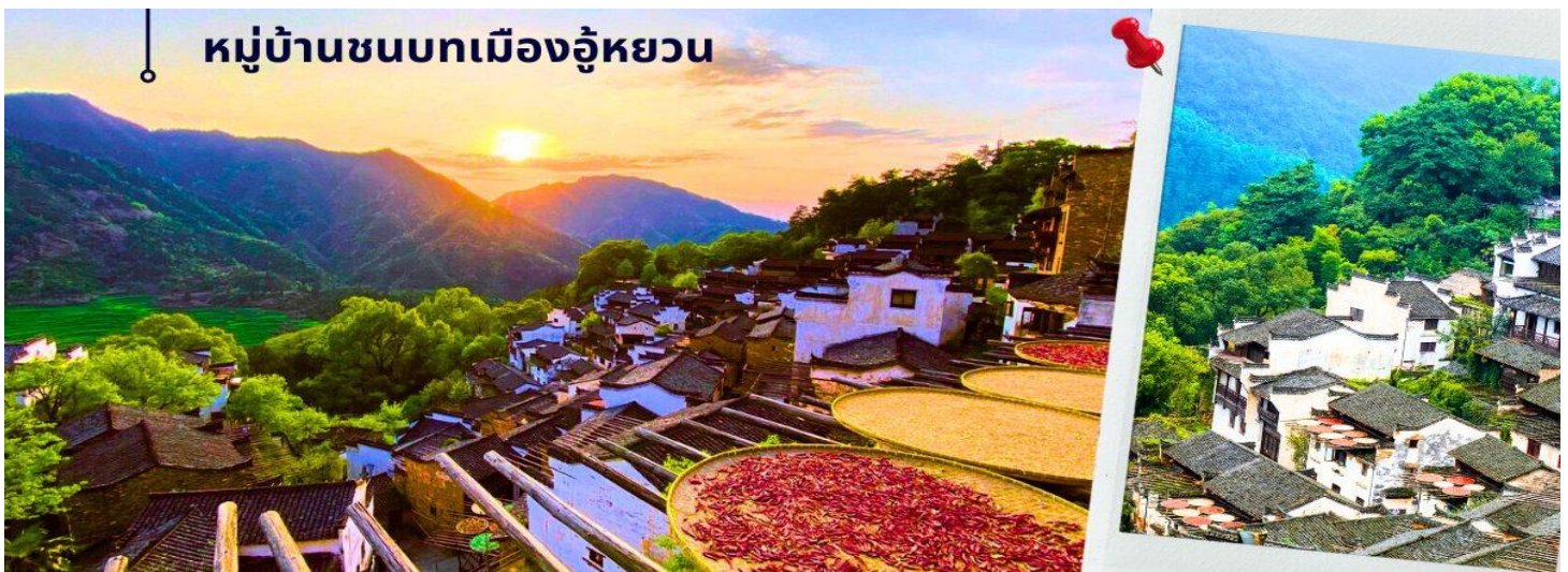
หมู่บ้านชนบทเมืองอู่หยวน

เที่ยง 📌 รับประทานอาหารกลางวัน ณ ภัตตาคาร (3) นำท่านเดินทางสู่ หมู่บ้านชนบทเมืองอู่หยวน ใช้เวลาเดินทางประมาณ 1.30 ชั่วโมง “เมืองชนบท ที่งดงามที่สุดของประเทศจีน” เป็นเมืองที่ธรรมชาติกลมกลืนกับวิถีชาวบ้านที่เป็นอยู่อย่างเรียบง่ายได้อย่างลงตัว บ้านเก่าแก่ที่อนุรักษ์ไว้อย่างดี สีสันความงามจากธรรมชาติหมุนเวียนไปตามฤดูกาล ทำให้นักท่องเที่ยวได้สัมผัสบรรยากาศที่แตกต่างกันออกไป ตามแต่ฤดูที่มาเยือนเมืองอู่หยวนแห่งนี้ ซึ่งชาวบ้านยังคงใช้ชีวิตอย่างเรียบง่าย ใช้ชีวิตสบายๆ ริมสายน้ำ ในพื้นที่สีเขียวที่โอบล้อมด้วยภูเขา ด้วยความห่างไกลเมือง และข้อจำกัดเรื่องการเดินทางเข้าถึงในสมัยก่อน ช่วยปกป้องให้อู่หยวนยังคงรักษาธรรมชาติและวิถีชีวิตแบบดั้งเดิมไว้ได้ แม้ว่าปัจจุบันการเดินทางมาที่อู่หยวนจะสะดวกสบายขึ้นมาก และการพัฒนายังเข้าถึงทุกหมู่บ้าน แต่โชคดีที่ผู้คนได้เรียนรู้แล้วว่า พวกเขาโหยหาและยังต้องการให้มีหมู่บ้านที่มีบรรยากาศแบบนี้อยู่ต่อไป ดังนั้น อู่หยวนจึงยังคงความบริสุทธิ์อยู่ได้ ภายใต้กระแสการพัฒนาสมัยใหม่ของจีน