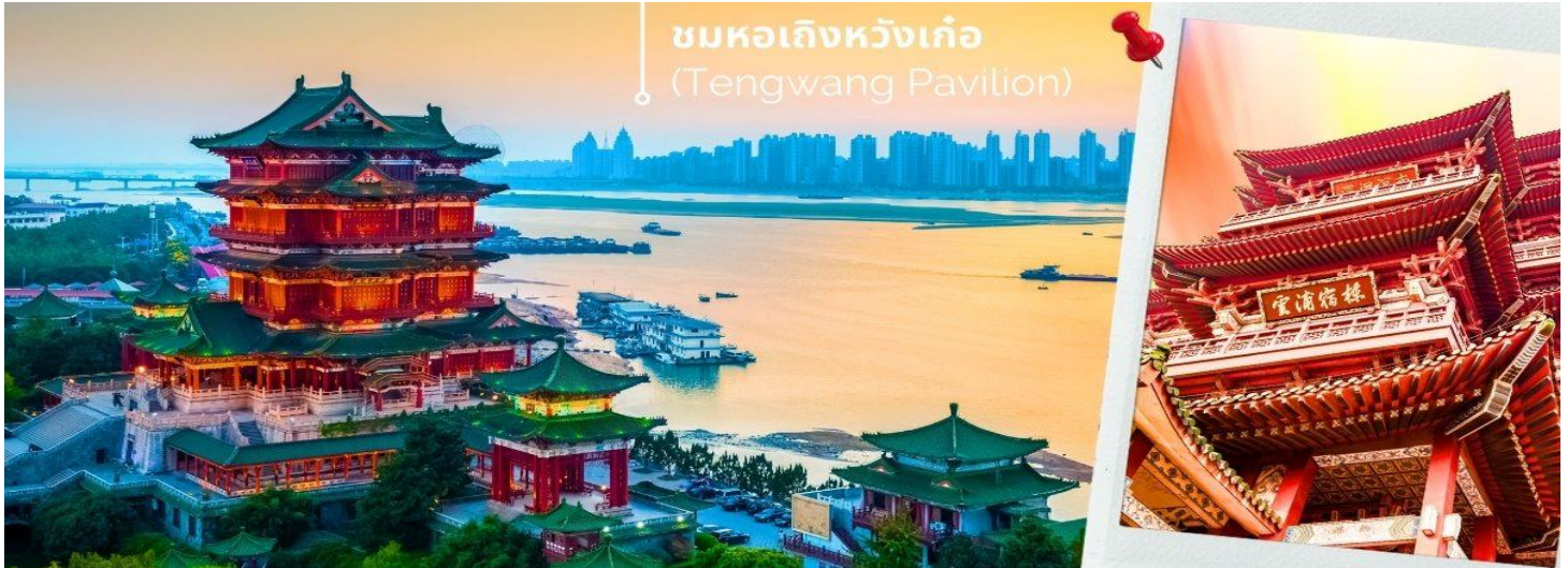
ชมหอเกิ่งหวังเก้อ (Tengwang Pavilion)

ด้วยบทกวีและภาพฝาผนังสมัยราชวงศ์ถังและอื่นๆ 1 ใน 3 หอที่มีชื่อเสียงที่สุดในเมืองฉินหวงสูง 9 ชั้น ริมฝั่งแม่น้ำกั้นเจียง ทางตะวันตกเฉียงเหนือของนครหนานชาง