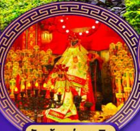
วัดเจ้าแม่กวนอิม ฮองซา