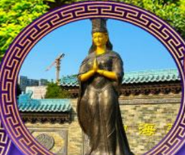
วัดเจ้าแม่กัมม