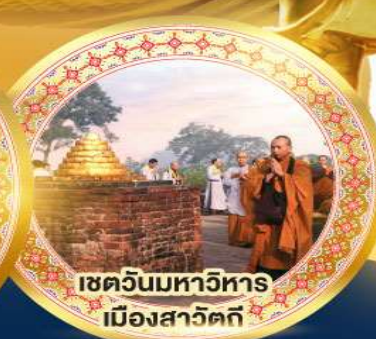
เขตรันมหาวิหาร เมืองสาวิตรี