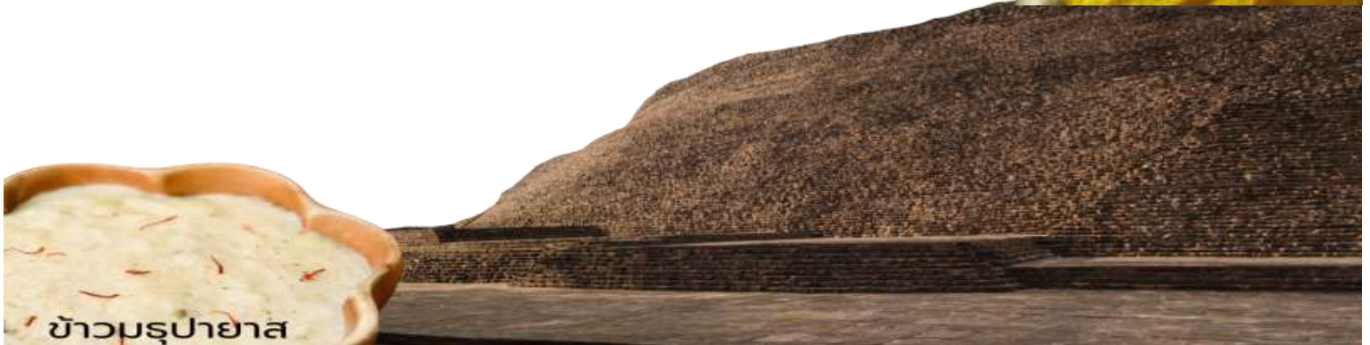
ข้าวมธุปายาส