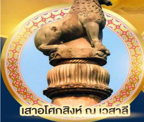
เสาอโศกสิงห์ ณ เวสาลี