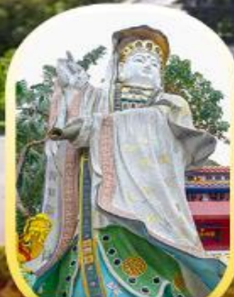
วัดเจ้าแม่กวนอิมรี พลัสเบย์