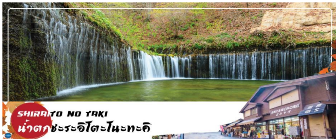
SHIRAITO NO TAKI น้ำตกชิระอิโตะโนะตะคิ

ถือเป็นน้ำตกที่ศักดิ์สิทธิ์ มีศาลเจ้าอาซามะตั้งอยู่ ด้วยการไหลของสายน้ำที่แยกสายออกเป็นหลากร้อยเส้น ทำให้มองดูแล้วเหมือนกับสายด้ายสีขาว จึงเป็นที่มาของชื่อเรียกที่ว่า ชิราอิโตะ ที่แปลตรงตัวว่า ด้ายสีขาวนั่นเอง อีกทั้งที่นี่ยังมีเรื่องราวของการปฏิบัติธรรมในถ้ำที่เคยเกิดภูเขาไฟปะทุขึ้นมาด้วย จึงทำให้ผู้คนให้ความศรัทธากันว่าเป็นที่ชำระล้างจิตใจ และเป็นพื้นที่ศักดิ์สิทธิ์สำคัญของผู้แสวงบุญ จึงถือเป็นพาวเวอร์สปอตอีกจุดหนึ่งในญี่ปุ่น ที่นี้สามารถชมฟูจิซังได้ในมุมที่ไม่เหมือนใคร เป็นน้ำตกและภูเขาไฟฟูจิตั้งอยู่ด้านหลัง และถือเป็นจุดชมใบไม้เปลี่ยนสีที่สวยงามมากอีกด้วย