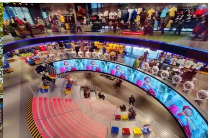
Page | 10