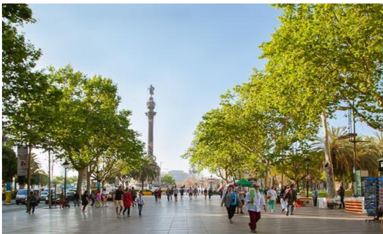
GO3LIS-EK004 Portual-Spain 10D7-EK

จากนั้นนำท่านเดินทางสู่สนามคัมป์นู ( Camp Nou ) สนามฟุตบอลของสโมสรบาร์เซโลน่า ที่มีขนาดใหญ่ที่สุด โดยมีความจุผู้เข้าชมได้ถึงเกือบ 99,000 คน ให้ท่านได้ถ่ายรูปด้านนอก พร้อมทั้งเลือกซื้อของที่ MEGA STORE ของทีมบาร์เซโลน่า นำท่านขึ้นสู่จุดชมวิวของเมืองที่เนินเขามองต์คูอิก ( Montjuïc ) เป็นเนินเขาในบาร์เซโลน่าที่มีทัศนียภาพอันงดงาม ทางด้านตะวันออกของเนินเขายังมีหน้าผาสูงชันซึ่งทำหน้าที่เป็นดั่งกำแพงเมือง ส่วนด้านบนเป็นที่ตั้งของป้อมปราการหลายแห่ง จากนั้นให้ท่านอิสระเดินเล่นบริเวณ ถนน ลา รัมบลาส ( La Ramblas ) ถือเป็นถนนชื่อดังของเมืองบาร์เซโลน่า นอกจากจะสะอาดสะอ้านและมีต้นไม้คอยสร้างความร่มรื่นให้ตลอดทางแล้ว ยังมีร้านค้ามากมาย โดยที่ปลายสุดของถนนสายนี้เป็นที่ตั้งของอนุสาวรีย์คริสโตเฟอร์ โคลัมบัส Christopher Columbus ผู้ค้นพบทวีปอเมริกาในปี ค.ศ.1492 อิสระให้ท่านเดินเล่นและช้อปปิ้งตามอัธยาศัย