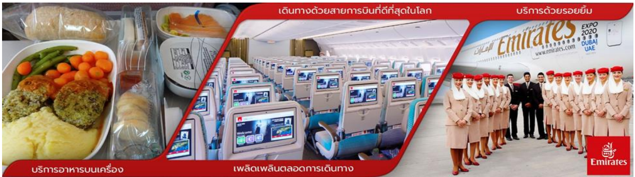
บริการอาหารบนเครื่อง

11.00 น. คณะพร้อมกันที่ สนามบินสุวรรณภูมิ ชั้น 4 ประตู 9 เคาน์เตอร์ T สายการบิน EMIRATES โดยมีเจ้าหน้าที่บริษัทคอยให้การต้อนรับ และอำนวยความสะดวกในด้านเอกสาร และการออกบัตรโดยสาร