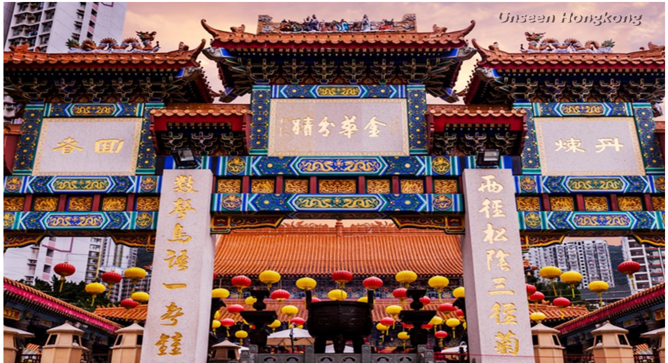
แล้วนำท่านเดินทางสู่ วัดหวังต้าเซียน (คนจีนวางตั้ง จะเรียกวัดนี้ว่า ห่วงไต้หวัน) เป็นวัดเก่าแก่อายุกว่าร้อยปี ที่ไม่มีวันเสื่อมคลายไปจากความศรัทธาของประชาชนชาวฮ่องกง คงจะสังเกตเห็นได้ทุกครั้งเมื่อมีโอกาสไปเยี่ยมเยียน ไม่ว่าจะเป็นมวลชนจำนวนมากที่มาสักการะ หรือแม้กระทั่งครันธูปคละคลั่งไปทั่วบริเวณ ท่านเทพเจ้าหวังต้าเซียน เดิมท่านชื่อ "ห่วงซ้อเผ่ง" เป็น